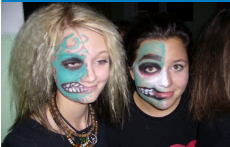
Halloweenská párty se vydařila.

V úvodu dnešního příspěvku bych chtěl poděkovat všem bývalým žákům i kolegům, kteří nám v uplynulém měsíci poskytli mnoho cenných fotografií z dob svého působení na naší škole. Budeme rádi, když nám zachováte přízeň i nadále a rádi uvítáme vaše zajímavé foto dokumenty především ze 60. a 70. let. A teď již k událostem uplynulého měsíce na naší škole.