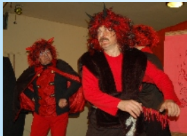
Na sv. Mikuláše nemohou chybět ani čerti. Autor: DK Ostrov