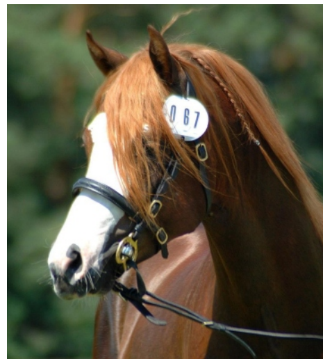
Autor: Denisa Pačanová

Koncem července jsme se zúčastnili IV. Shetland Pony Show Chomutov, kde se nám opět dařilo. Ve výstavě jsme získali dva vítěze tříd, Šampiona kategorie jezdeckých pony a titul Vícešampiona mladých všech plemen výstavy (dvouletá Pr. Delu Surprise). L. Proud pak vybojovala i titul Senior Vícešampiona všech plemen. Dnes již soukromý pony Pr. First Pride přidal ještě 2. místo ve své kategorii. Ani děti se nenechaly zahanbit! Ve svých velmi početných třídách si sponíky vysoutěžily 2x 1. místo a 2x 5. místo.