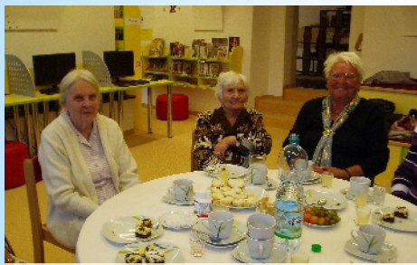
Program pro seniory v MK Ostrov. Autor: Domov pro seniory Pernink p. o

Obyvatelé a zaměstnanci Domova pro seniory v Perninku, p.o. by touto cestou chtěli poděkovat zaměstnancům knihovny v Ostrově. Rok co rok jsme zváni na přednášky a přátelské posezení, o občerstvení a program se vždy skvěle postarají zaměstnanci knihovny a po celé dopoledne nám věnují svůj čas. Na tyto setkání se vždy těšíme. Pozvání ze strany knihovny nebereme jako samozřejmost a nesmírně si vážíme lidí, kteří se snaží druhým zpříjemnit život. Velmi si ceníme toho, že na nás myslíte. Děkuje Vám.