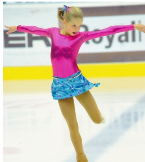
Autor: Mgr. Monika Škorníčková