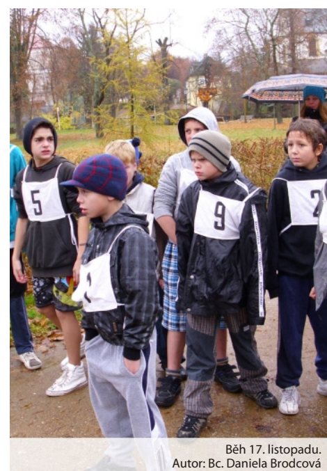
Běh 17. listopadu.

Jistě jste zaznamenali debatu o zrušení základních škol praktických. Všichni zaměstnanci naší školy se podepsali pod petici proti tomuto záměru, sdílející přesvědčení, že jde o nezodpovědný krok, jdoucí proti zájmům dětí i společnosti, odporující převládajícímu názoru odborníků a lidí z praxe. Pokud vám není lhostejný osud dětí se speciálními vzdělávacími potřebami, apelujte prosím na své volené zástupce či se připojte k podpoře petice.