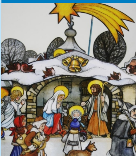
Ostrovské betlémy opět ozdobí prostory kláštera. Autor: Věra Čarná

Ještě se ohlížíme za krásným barevným podzimem, užili jsme si sluníčka, procházek, kulturních, sportovních a společenských akcí a setkání. Naše město poskytuje dostatek příležitostí pro využití volného času. Každý si může vybrat z pestré nabídky programů podle své chuti. Nejinak tomu je i v prosinci. Nové vydání Ostrovského měsíčníku to bohatě naplňuje. Všechny instituce, školy, organizace chtějí přispět svými nabídkami k oslavení nejkrásnějších svátků v roce – Vánoc. Již několik let se chodí do klášterního kostela „na betlémy“. Je tomu tak i letos. Jako mluvčí ostrovských betlemářů, tvůrců a sběratelů mohu prozradit, že jsme od léta pracovali, abychom představili opět něco nového, překvapivého. A znovu jsme s napětím očekávali, zda se k nám přidají i další zájemci z řad veřejnosti. Výstava vypovídá o tvořivosti a fantazii, ale především o tom, že se kdysi kdosi narodilo dítětko všemi vítané, s láskou obdarované. A tak by to mělo být. Přijďte se podívat, vernisáž se koná ve čtvrtek 6. prosince od 17.30 hodin. Nejen na betlémy, ale i na krásné architektonické skvosty našeho města vyhlížející v zimní sváteční náladě.