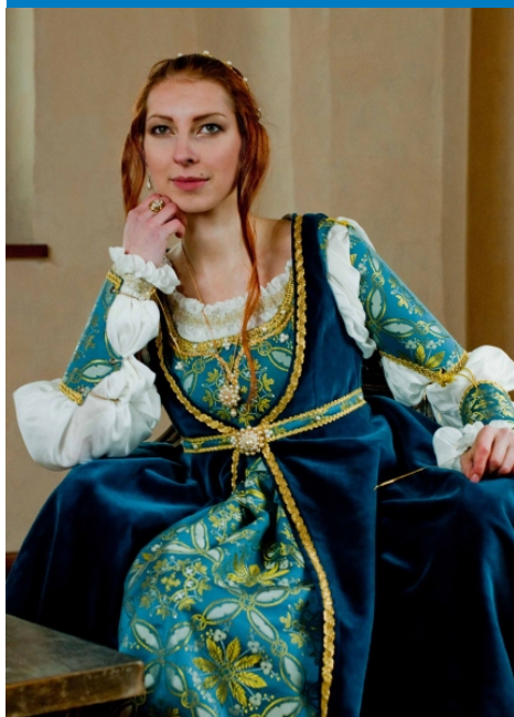
Autor: Eliška Failová