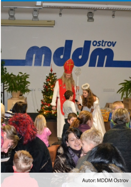
Autor: MDDM Ostrov