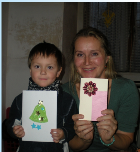
Autor: Ing. Jan Bureš