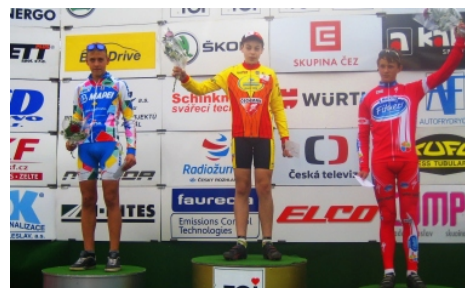
Vítězství v ČP v Mladé Boleslavi. Autor: Josef Krs