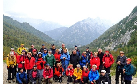
V sedle Vršic v Jurských Alpách.