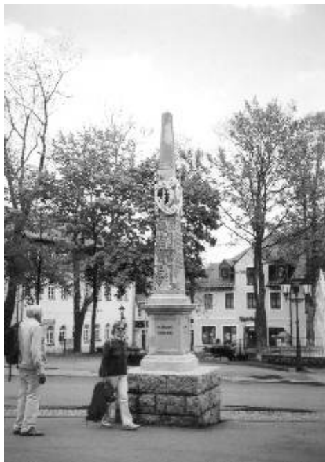
Poštovní milník z roku 1730