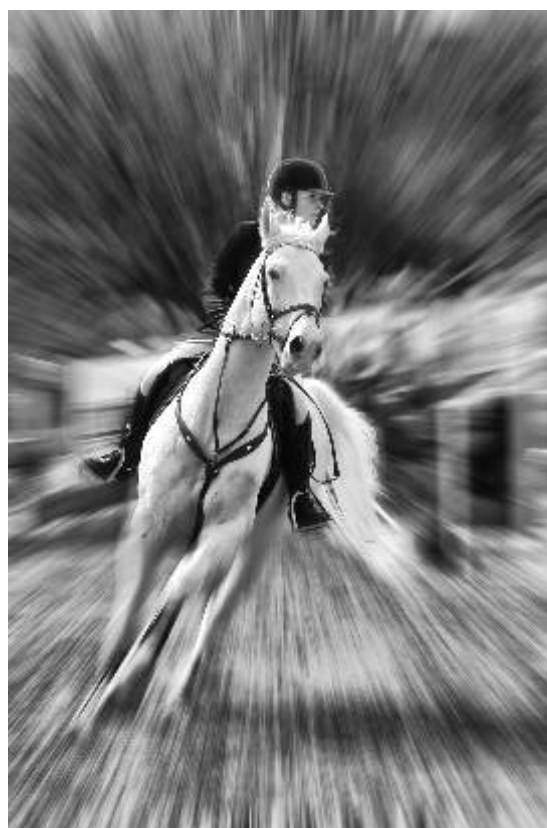
Fotografie měsíce Fotoklubu Ostrov Název: Jako vítr... Autor: Miloslav Křížek