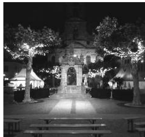
Nasvícený večerní Rastatt