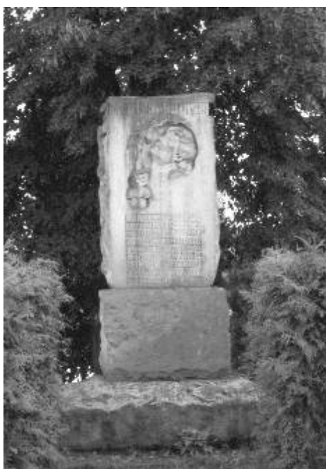
Pomník padlým vojákům