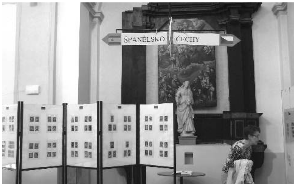
Výstava Krásný svět zápalkových nálepek zatím zaujala každého návštěvníka.