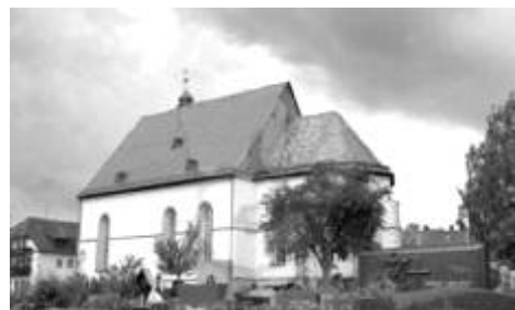
Hřbitovní kostel ve Wunsiedelu