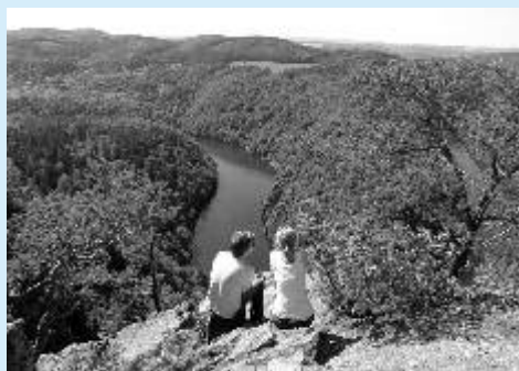
Vyhledka na Vltavou - Máj