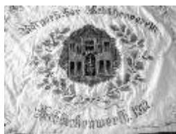
Prapor Střeleckého spolku Schlackenwerth z roku 1912