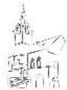
STARÁ RADNICE OSTROV

Uskuteční se již III. ročník ruční paličkové krajky z oblasti českého Krušnohoří. Členky sdružení navazují na tradici a prastaré řemeslo v této oblasti.