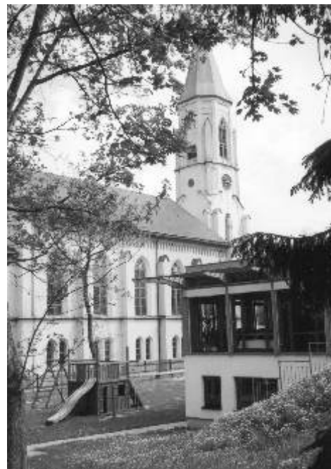
Novogotický kostel Martina Luthera