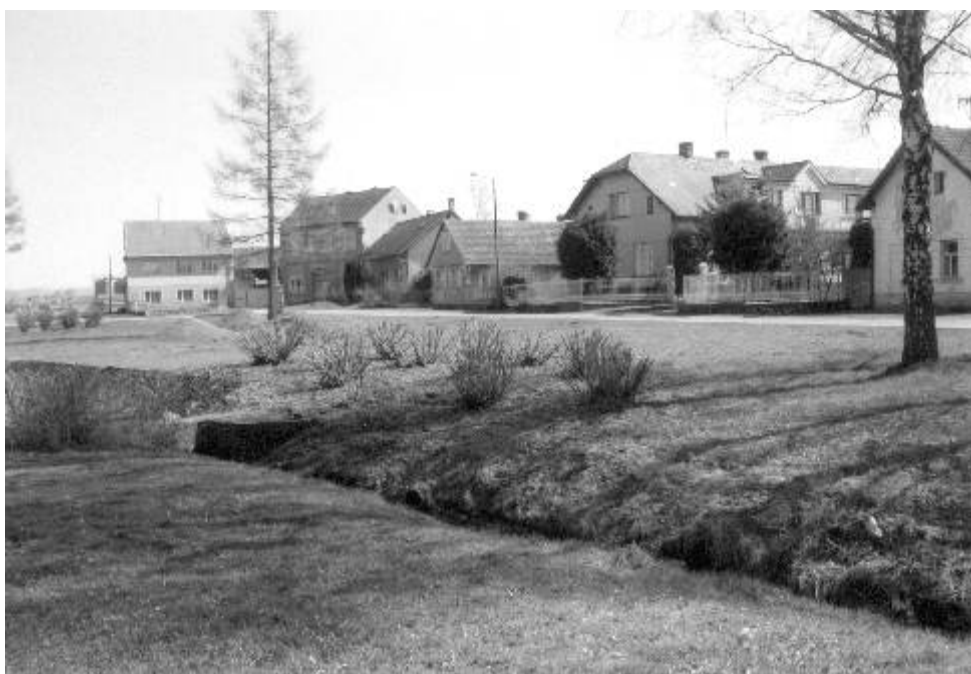
Ostrov v Podchlumí