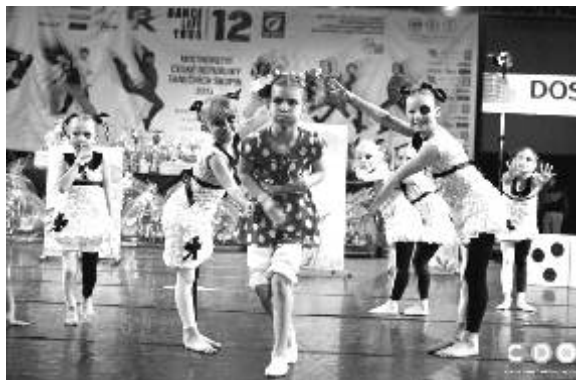
Houfem ovečky, 1. místo, Mistrovství ČR art formací

Pro ostrovské tanečnice to však nebylo první význam-