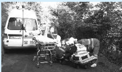
Záchrana osoby, Mořičovská ulice

Do Severní ulice jsme vyjžděli k likvidaci požáru velkoobjemového kontejneru. Jednotka vyjela k požáru trávy na ostrovské průmyslové zóně a na Velkém Rybníku. Společně s jednotkou z Hroznětína a KV jsme zasahovali při požáru komína rodinného domu v Odeři. V Jáchymově s jáchymovskou a karlovarskou jednotkou jsme jeli k požáru kuchyňského sporáku, ale na místě bylo zjištěno, že se jedná o planý poplach. V zahrádkářské kolonii v Ostrově jsme likvidovali požár odpadu a kabelů. V Horním Žďáru jsme odstraňovali uvolněné plechy ze střechy rodinného domu, v pensionu na Hlavní třídě jsme byli otevřít byt (na žádost Policie ČR) a v Seifertově ulici naše jednotka likvidovala biologický odpad po