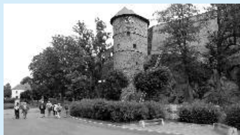
Z výletu do Chebu - pod hradem

30. června Z Perninku Dřevařskou cestou do Johannegeorgstadtu