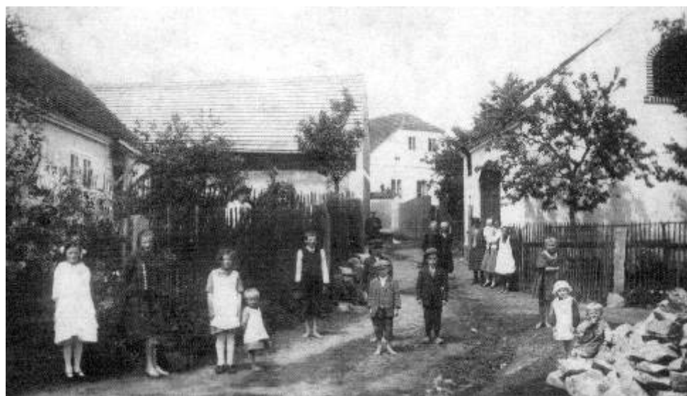
Dobový snímek Ostrova ze začátku 20. století

V místě též můžeme navštívit soukromou galerii G 20, pořádatelkou výstavy obrazů, keramiky, divadelní a hudební představení. Zde opouštíme kraj skalních skřítků a míříme do podhůří Krkonoš za dalším cílem našeho putování. Lubomír Mayer