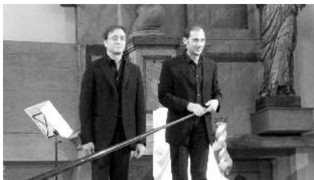
Festival uprostřed Evropy, záběr z jednoho z minulých ročníků