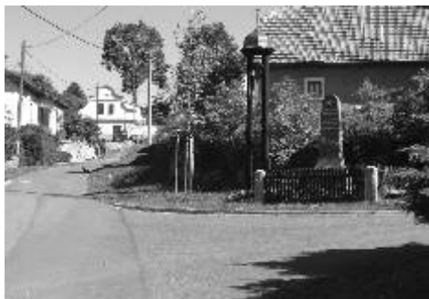
Ostrov v současnosti

První zmínka o obci pochází sice až z roku 1333, ale živo zde bylo zcela určitě již dávno před tímto letopočtem. V okolních kopcích se nacházely stříbrné a železné rudy, potoky zase nabízely blyštivé zlato. Dokládá to mnoho starých rýžovišť a nálezy železných strusek na ostrovském katastru. Kolonizovat místní kraj započali němečtí osadníci a s nimi i řady benediktinů