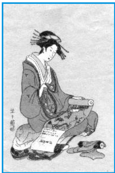
Exponát z výstavy Krásný svět zápalkových nálepek