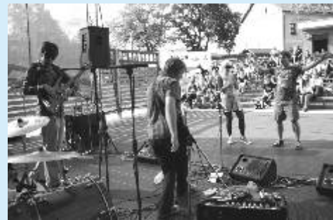
Letní rocková scéna