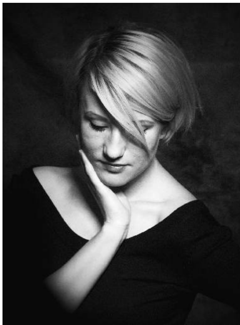
Fotografie měsíce Fotoklubu Ostrov. Autor Milan Martinek