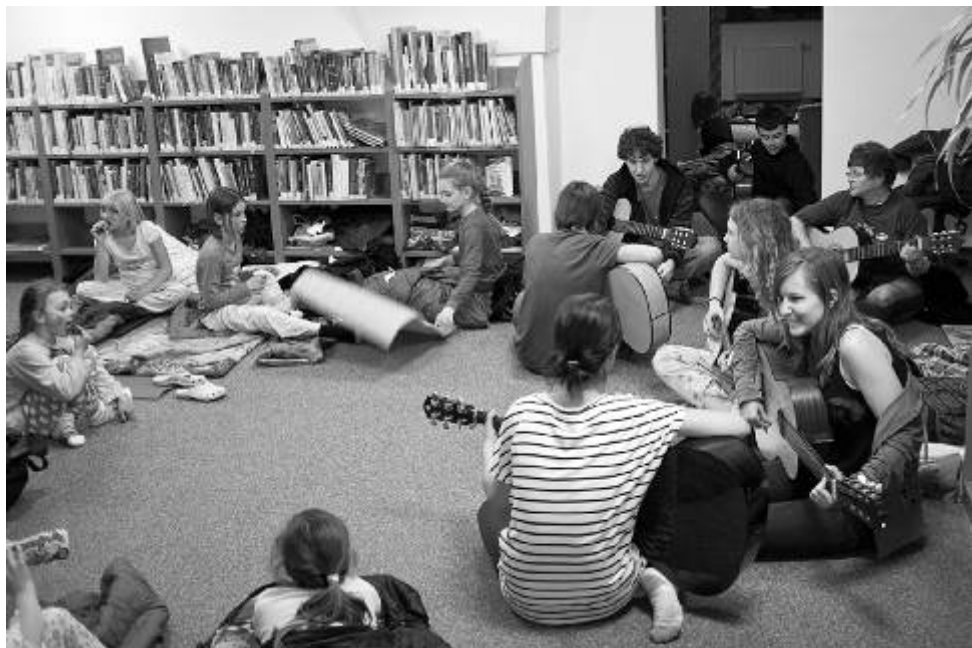
Na akci Noc s Andersenem i tentokrát vládla pohodová atmosféra.