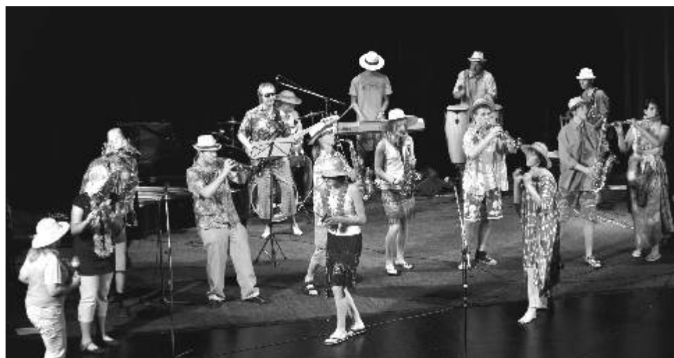
Písk-písk ...Proč ne rok 2009 - Mambo