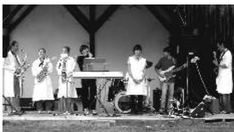
Písk-písk Čili peppers rok 2005 - Resuscitace

Písklata nejmladší kapely tvoří žáci prvních až třetích tříd ZŠ, kteří obvykle hrají za doprovodu učitele na zobcové flétny. V repertoáru mají lidové i umělé písničky a zhudebněné básničky, které zpívají a hrají k nim mezihry, případně je na jevišti předvádějí. Druhé stádium tvoří žáci čtvrtých až šestých tříd ZŠ. V kapele se objevují začínající klarinetisté, flétnisté, kytaristé, klavíristé apod. Repertoár je velmi různorodý: zhudebněné básně, populár, jazz, etnická hudba, středověké parodie, kramářské písně a jiná instrumentální hudba. Vše záleží na momentálním obsazení