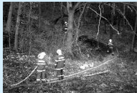
I v takto nepřístupném prostoru musí hasiči zasahovat.

K dopravní nehodě osobního vozidla jsme vyjžděli do Mořičovské ulice, řidič byl lehce zraněn. K další nehodě jsme byli vysláni s karlovarskou jednotkou: řidič najel na kompresor z lednice a došlo k proražení olejové vany vozidla. K požáru buňky za Benzinou jsme vyjžděli s jednotkami z Hájku, Jáchymova a Karlových Varů, na místě byla zjištěna jedna zraněná osoba, která byla předána záchranné službě. V Kollárově ulici jsme likvidovali požár osobního automobilu. Likvidovali jsme požár lesního porostu u obce Boč společně s jednotkami ze Stráže a Klášterce nad Ohří a HZS Klášterec nad Ohří. Další požár lesního porostu jsme likvidovali podél železniční tratě od studánky po pískovnu, na