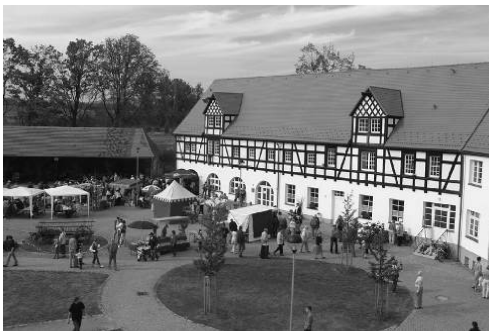
Netradičně a s předstihem si mohou děti užít Den dětí na statku Bernard - pořádá MDDM Ostrov spolu s OS Benjamin.