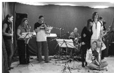
Písk-písk s.r.o. rok 2006 - Děti

1997 až 2007: Písk-písk („s.r.o.“) s rockovým, jazzovým i zpívaným repertoárem. Kapela měla největší počet všestranně vzdělaných hráčů, byla to klasika i jazz a ukončila svou činnost v neuvěřitelně velkém obsazení. Z repertoáru vyzdvihneme CD Děti (25minutová