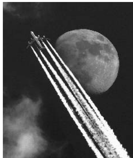
Fotografie měsíce Fotoklubu Ostrov - Atak na měsíc, Alois Matula