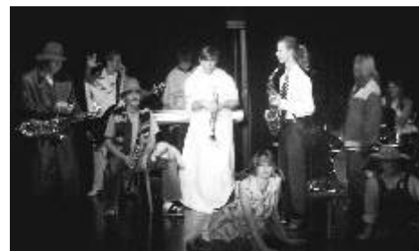
Písk-písk Džezmeni rok 2009 - Betlém