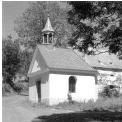
Kaple Panny Marie

Verušičky, v současnosti zde žije kolem 30 obyvatel. Od roku 1897 zde byla jedna ze zastávek na železniční