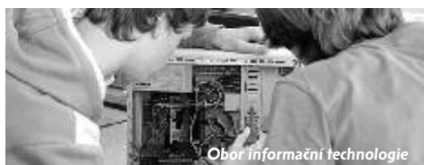
Obor informační technologie

Nejmodernější střední škola republiky je rozhodně dobrou volbou. Nabídka oborů zůstává nezměněna, zahrnuje obory zaměřené na výpočetní techniku, elek-