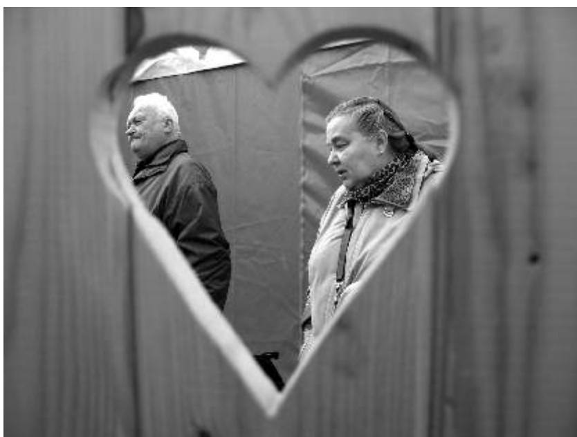
Fotografie měsíce Fotoklubu Ostrov. Název „Miluji Tě“

Dne 3. prosince v 16.00 hod. se koná Mikulášská nadílka pro děti. Mohou se těšit na skvělou zábavu, diskotéku a spoustu dáreků. Přijde Mikuláš, čerti i anděl. Případné rezervace na místě. Karel Kunz