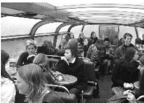
Gymnazisté na grachtu