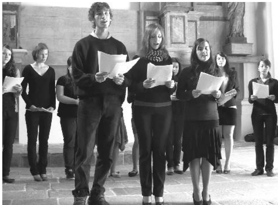
Pěvecký sbor gymnázia Ostrov si můžete poslechnout 15. prosince v 17.30 hodin na Staré radnici Ostrov.

přitelně zážitky společné. Namátkou můžeme připomenout plavbu po grachtu (umělém kanálu), návštěvu sídla královské rodiny, prohlídku Amsterdamu... Nejhlubším (a to doslova) zážitkem však byla, jak se všichni shodují, procházka aktivní bažinou, jíž by nepohrdnul ani Král Šumavy. Úctyhodným výkonem byl i horolezecký výstup na nejvyšší „horu“ celé provincie Oldenzaal, Tankenberg měřící plných 86 metrů! Tím nejdůležitějším ale bylo samozřejmě poznání životního stylu v jiné zemi, a zejména každodenní komunikace v angličtině. Naši studenti si tedy přímo v praxi ověřili i prohloubili své jazykové a konverzační dovednosti.