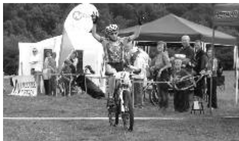
O pohár města Ostrova