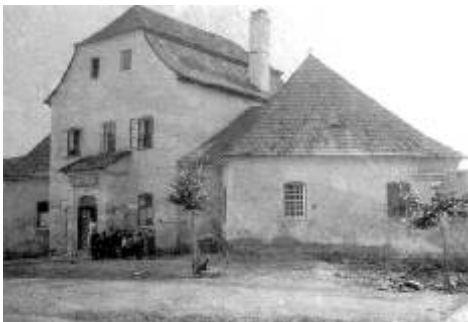
Santiniho panská hospoda

Za Jakuba Míty z Vostrova bylo v obci postaveno rytířské sídlo, pivovar a čtyřobloukový most přes Oslavu. Obec získala tehdy některá měšťanská práva, zvláště právo tržní. Zlé časy přišly po Bílé hoře, kdy obec ztratila svoji samostatnost a navíc r. 1621 zcela vyhořela. Na spáleníšti fary byla o sto let později, dle návrhu Jana Blažeje Santiniho, postavena panská hospoda. Je to ojedinělá barokní stavba, která má