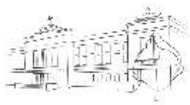
DŮM KULTURY OSTROV