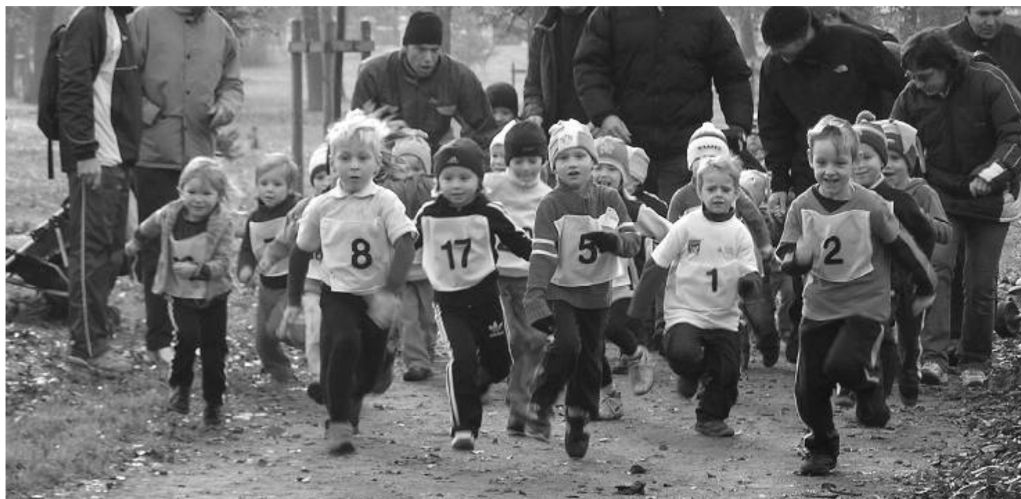
Děti v Běhu 17. listopadu nasazují všechny své síly a odhodlání zvítězit.