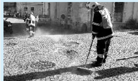
Hasiči likvidují následky dopravní nehody na Starém náměstí

Celkem čtyřikrát neznámý pachatel zapálil velkoobjemové kontejnery na odpady v ulicích Májová, Luční, Štúrova, Kollárova a Tylova, které jsme společně s karlovarskou jednotkou likvidovali v brzkých ranních hodinách. Dále jsme byli vysláni k prověření vystupujícího kouře z lesa nedaleko Ostrova, ale bylo zjištěno, že se jedná o planý poplach. V Masarykově ulici jsme 6. září likvidovali obtížný hmyz v prostorách mateřské školy. K likvidaci olejových skvrn jsme vyjízďeli dvakrát: do ulic Severní a Lidická. K dopravní nehodě dvou osobních automobilů jsme byli vysláni na křižovatku ulic Lidická