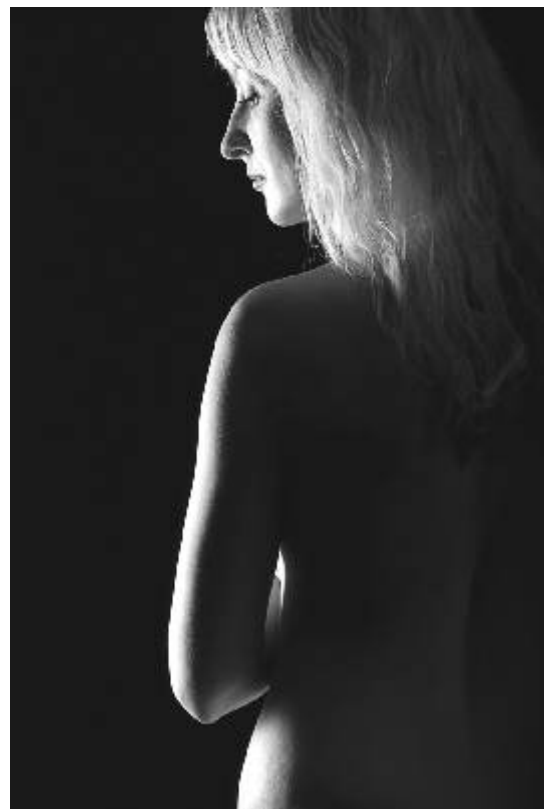
Fotografie měsíce Fotoklubu Ostrov.

Pokračování vánoční dílny bude věnováno výrobě vánočních dekorací do bytu a originálním ozdobám na stromček. Vstupné na obě dílny: plné 45 Kč, snížené 30 Kč. V ceně vstupného je zahrnut veškerý výtvarný materiál a malé občerstvení.