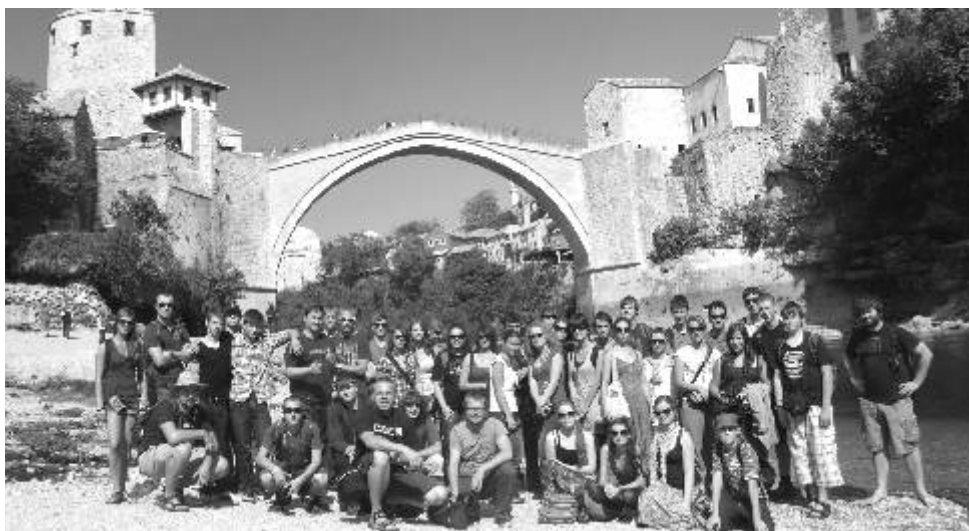
Návštěva Mostaru byla pro studenty velkým zážitkem.