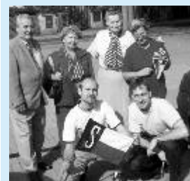
Sletová štafeta ve Stráži nad Ohří

Přípravy XV. všesokolského sletu začaly hned po skončení XIV. sletu výběrem cvičebních i hudebních skladeb pro hromadná vystoupení, výukou cvičitelů,