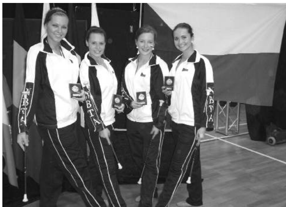
Úsměvy dívek vyjadřují radost z umístění na Mistrovství Evropy.