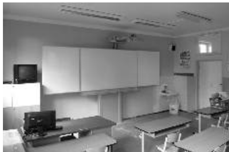
Velkým přínosem pro výuku jsou interaktivní tabule.

mezi žáky a učitelem pomocí sluchátek a mikrofonů. Z projektu EU peníze do ZŠ JVM a MŠ Ostrov byla škola vybavena novými tabulemi doplněnými interaktivními projektory, a tak máme téměř ve všech učebnách interaktivní tabule, díky kterým se od září zásadně změnil způsob výuky většiny předmětů. Připomínám, že od března 2011 jsou v rámci projektu