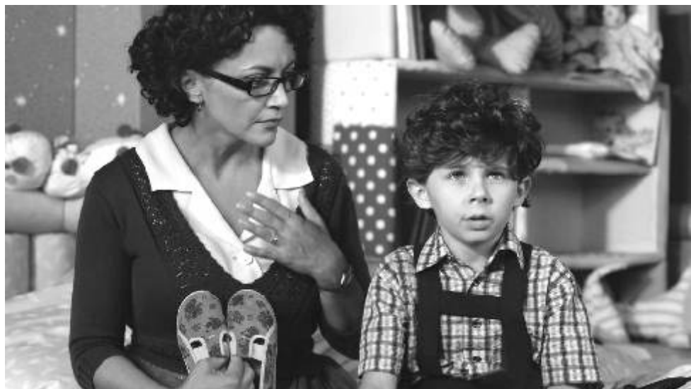
Ve filmu V peřině měl možnost zahrát si i s Lucíí Bílou.