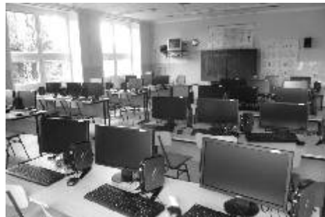
Novotou září také počítačová učebna.

především pro jazykovou výuku, ve speciálních třídách mají žáci k dispozici notebooky se speciálními výukovými programy pro kompenzaci poruch učení. V jazykové učebně byl instalován nový nábytek, který bude v příštím kalendářním roce doplněn o audio systém pro jazykovou výuku, umožňující mj. přímou komunikaci