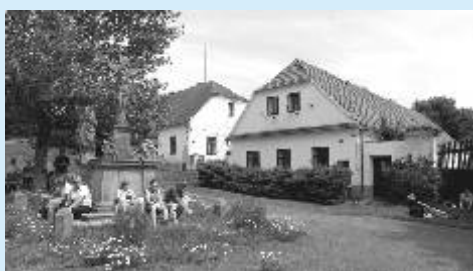
Stranná - odpočinek u Kalvárie