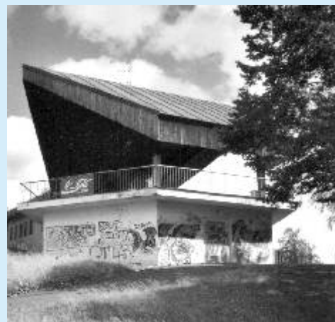
Nezvaní „umělci“ vnucují návštěvníkům koupaliště své výtvary.