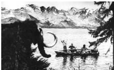
Cesta do pravěku (1955)

natáčení a trojrozměrné exponáty. Zemanovy příběhy se odehrávají ve fantastním světě na pomezí snů a reality. Jsou plné hravosti, nadsázky, jemné ironie a laskavého humoru. Filmové obrazy dokázal naplnit