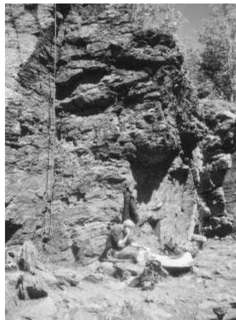
Skály Na Strašidlech