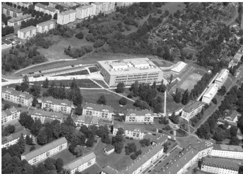
Letecký snímek nové školy