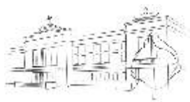
DŮM KULTURY OSTROV