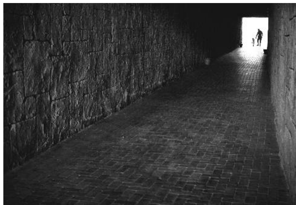
Fotografie měsíce Fotoklubu Ostrov.