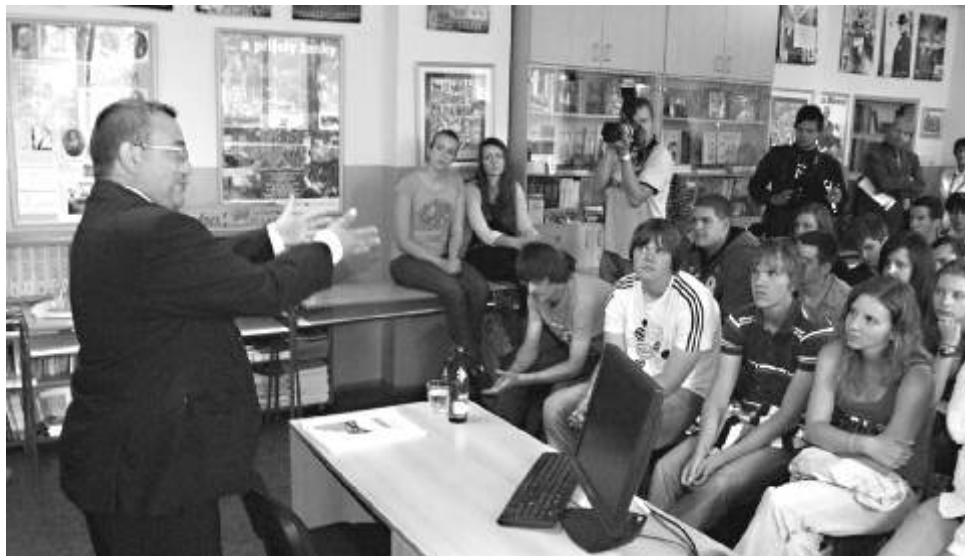
Ministr školství Josef Dobeš na besedě se studenty gymnázia

Během prázdnin se gymnázium „převléklo do nového kabátu“. Oba pavilony byly zatepleny a opatřeny