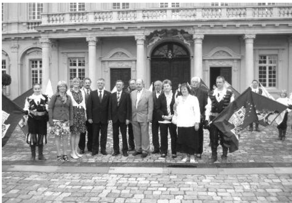
Součástí červencových oslav bylo otevření Ostrovského náměstí v Rastattu.