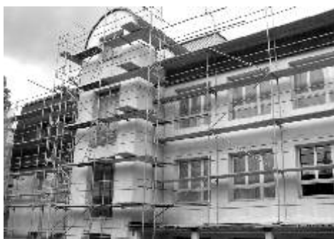
Z průběhu oprav nové fasády budovy gymnázia