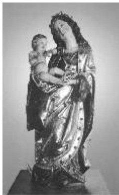
Panna Maria Věrná, Ostrov