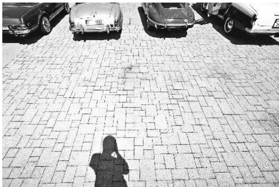
Fotografie měsíce Fotoklubu Ostrov. Název: Veteráni Autor: David Papánek

Vánoční výstava a výtvarná soutěž o Nejkrásnějšího anděla. Výtvarné práce žáků chebských MŠ a ZŠ. Návštěvníci mohou hlasovat o vítězi, jehož vyhlášení se uskuteční 15. prosince v 10.00 hod. ve Valdštejnské obrazárně.