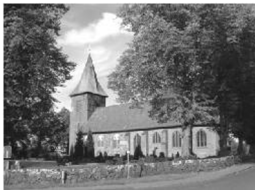
Kostel Panny Marie, původně ze 13. století, Büchen