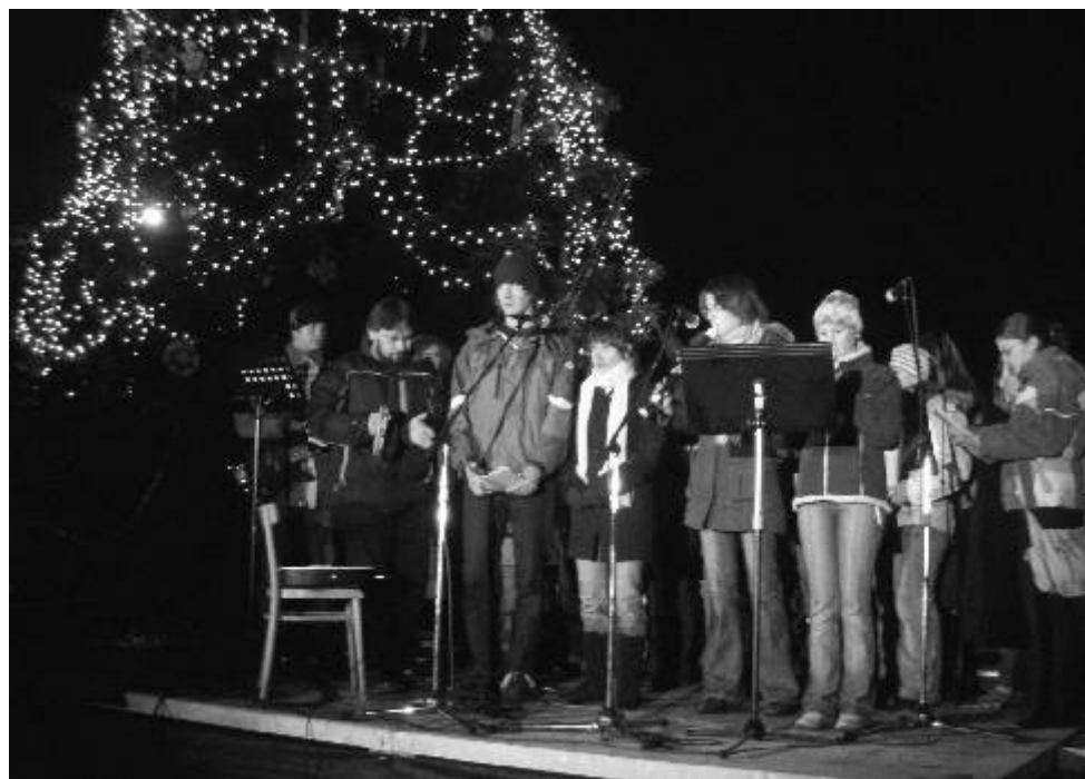
Rozsvícení vánočního stromu na Mírovém náměstí doprovází kulturní program.