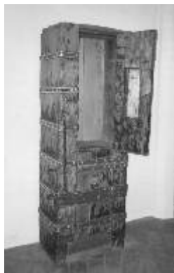
Schrána na madonu, Büchen