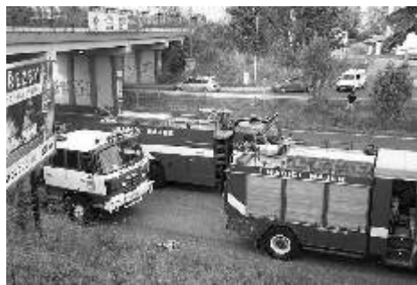
Při akci dne 24. srpna

Bohužel i v srpnu došlo k tragické události: parta pěti lidí sjížděla řeku Ohří na raftu přes radošovský jez, raft se s nimi převrátil, čtyři osoby byly vytaženy ihned, ale mladou dívku se již nepodařilo zachránit. Tříkrát jsme likvidovali vosí hnízda (ul. Myslbekova, u Domu kultury a na poště v Kyselce). Poslední srpnový den byl ohlášeno únik plynu v ul. Karlovarská, průzkumem na místě bylo zjištěno, že se jedná o prověřovací cvičení jednotky.