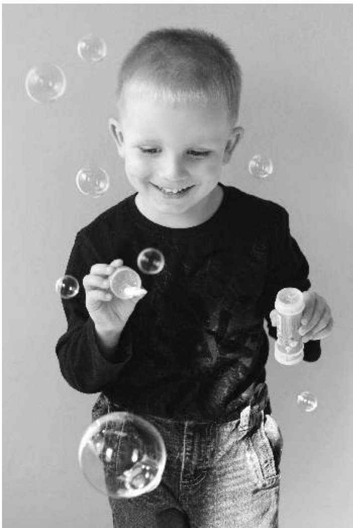
Štěpa a bublifuk. Fotografie měsíce Fotoklubu Ostrov. Autorka: Alena Štočková