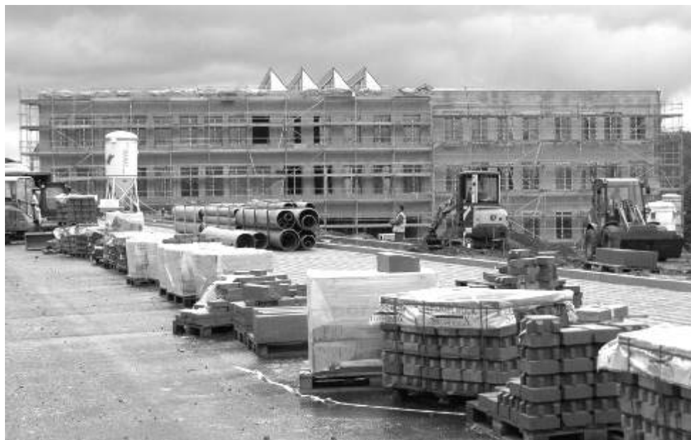
Centrum technického vzdělávání - stav k 31. srpnu 2010

Další fotografie z výstavby si můžete prohlédnout na http://apdm.cz/projekty/ctv-ostrov/?sub=fotogalerie