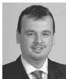
Ing. Jan Bureš, starosta města Ostrova a poslanec Parlamentu České republiky

služby vybudováním nových stanic záchranek, čímž se podstatně zkrátil dojezdový čas do menších obcí. Toto opatření již zachránilo životy lidí. Významně také pomohl karlovarské nemocnici opravami pavilonů a přípravou výstavby nového pavilonu akutní medicíny. Ze všech karlovarských politiků má nejlepší přehled o situaci v karlovarském zdravotnictví. Proto ho za svou profesi podporuji v senátních volbách.