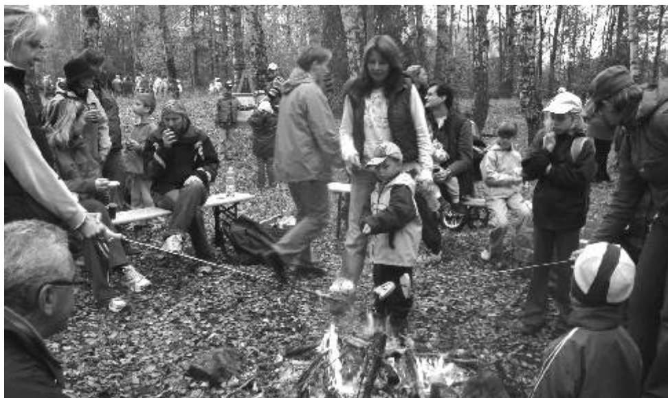
Podzimní víkendová stezka 2009

Informace: Ekocentrum po-čt 10.00-18.00 hod., pá 10.00-17.00 hod., tel. 353 842 389, 731615658, Facebook: Ekocentrum MDDM Ostrov