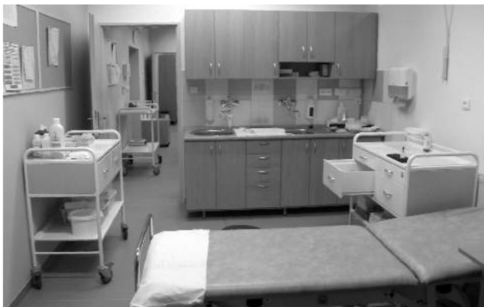
Ošetrovna na oddělení následné péče

Mimořádné bruslení pro veřejnost o školních prázdninách a svátcích bude v předstihu uvedeno ve vývěsní skřínce před zimním stadionem v Ostrově a na www.zsoostrov.com