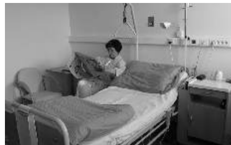
Nadstandardní pokoj v NO

Nemocnice je ve finální fázi příprav k získání akreditace SAK, akreditační šetření proběhne ke konci tohoto roku. Nemocnice Ostrov obhájila paralelně (letos již popáté) certifikát kvality řízení dle normy ISO. V nemocnici byla provedena instalace nové telefonní ústředny. Nově bude možné při znalosti konkrétní linky volat do nemocnice na číslo 353 364 plus příslušná linka, kdy se klient dovolá přímo, nemusí tedy volat přes ústřednu. S účinností od 1. srpna jsou nastaveny změny týkající se cen za využití nadstandardních pokojů. Za první až šestý den pobytu zůstává cena 500 Kč na den, za sedmý až 10. den se snižuje na 300 Kč na den a od 11. dne pobytu a déle zaplatí klient 100 Kč na den. Cílem je snížit náklady při dlouhodobé hospitalizaci klientů. Začátkem září bude po generální rekonstrukci otevřena nová stanice Oddělení násled-