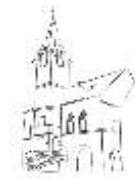
STARÁ RADNICE OSTROV

Zápis i předprodeji byl již zahájen v IC v DK Ostrov.