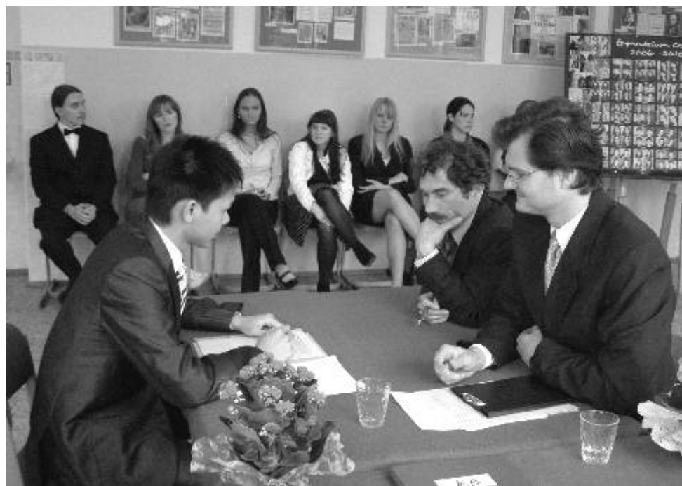
Přinese nový školní rok i nové maturity?

Redakční rada Ostrovského měsíčníku přeje všem žáků a učitelům úspěšný nový školní rok.