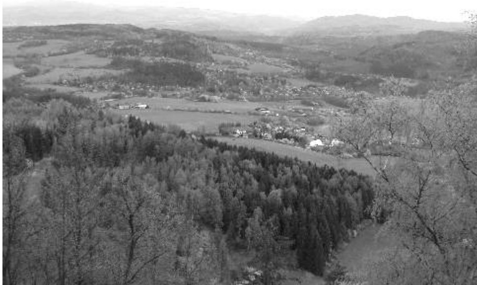
Pohled z vrcholu Šemnické skály