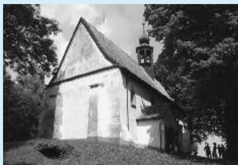
U poutního kostela sv. Linharta v Uhlíšti