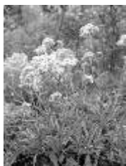
Tařice skalní (Aurinia saxatilis)

Na cestu jsem se vydal z Karlových Varů, odkud mě kroky vedly do okolních kopců tvořících okraj Slavkovského lesa. Po Gogolově stezce, která návštěvníkům poskytuje mnoho výhledů na město z ptáčích perspektiv, jsem pokračoval na rozcestí, odkud se lze dostat na Goethovu rozhlednu. Zvolil jsem druhou variantu a v cestě pokračoval směrem k přírodní památce Olšová vrata. Procházel jsem jehličnatým lesem, jehož porosty byly místy zcela zdevastované kůrovcem a také malou odolností smrků vůči působení silnějšího větru. Na mnohých místech tak vznikly plochy bezlesí, které poskytují zajímavý pohled na Krušné hory. Zanedlouho jsem dorazil k dopravní tepně vedoucí z Karlových Varů na Prahu. Skoro jsem nemohl uvěřit vlastními očima, že turistická stezka vede skrz silnici, kde auta jezdí běžně rychlostí přes 100 km v hodině. Sprintem jsem tedy překonal tuto nebezpečnou překážku a pokračoval v cestě za určeným cílem. Zanedlouho jsem se od-