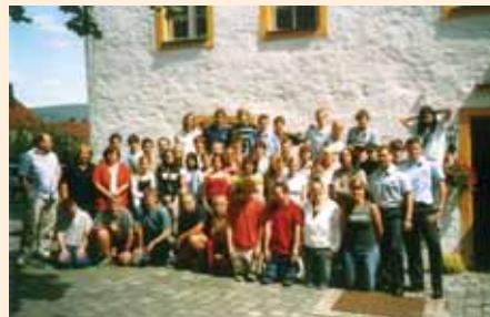
Skvělým zpestřením byl výlet do Norinberku a seznámením s jeho ranou i nedávnou historií.

Poprvé v tomto školním roce byl zařazen do učebního plánu maturitních ročníků týdenní studijní pobyt v SRN. Budoucí maturanti si měli možnost zahrát se svými německými vrstevníky na politiky, ekonomy, ekology či novináře v simulované hře POL&IS, organizované vzdělávacím centrem ve Weidenbergu.