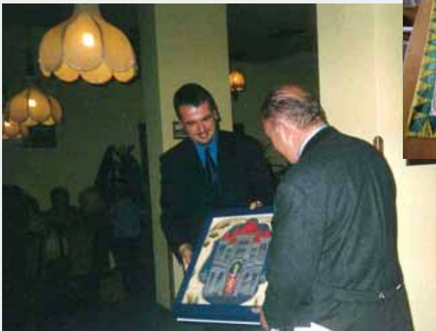
Předání kopie střeleckého praporu