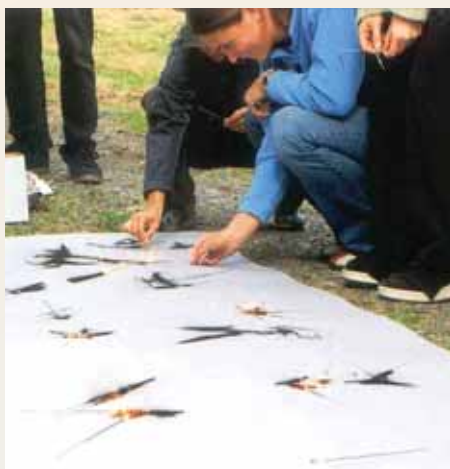
B. Hořínek - Kresba propalovaná prskavkami.