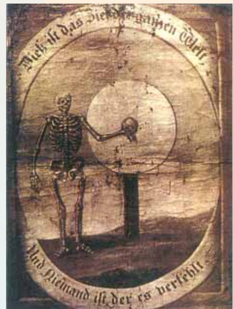
Pohřební štít spolku ostrovských střelců z roku 1830 (Toto je cíl celého světa a není nikoho, kdo by jej minul)

také značný finanční příspěvek na záchranu Einsiedelské kaple. Letošní setkání obou spolků mělo mimořádně slavnostní ráz. Starosta Ostrova předal předsedovi spolku rodáků kopii historického praporu střeleckého spolku z roku 1912 pro historickou síň Ostrova - Schlackenwerthu, zřízenou