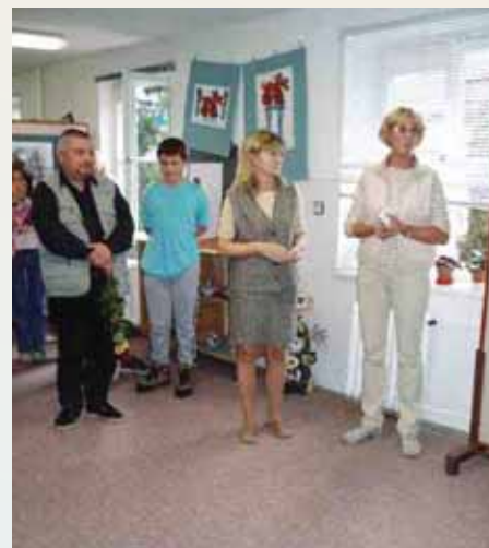
ZUŠ má svou galerii v budově školy - Masarykova 715