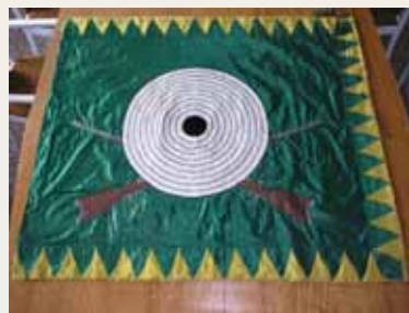
Líc a rub čtvrtého a posledního praporu Měšťanského střeleckého spolku v Ostrově. Originál je v majetku města Ostrova.

Svatomichaelskou pouť už čtrnáct let provází událost či události týkající se města i s nahlédnutím do jeho historie. Letos byly k tomuto datu ukončeny úpravy Mírového náměstí, oživeného dvěma kašnami s vodotrysky. Došlo ovšem i na okénko do minulosti, a to nejen příjezdem markraběnky Sibylly Augusty. Každoročně se pouti k svatému archandělu Michaelovi zúčastňuje spolek ostrovských rodáků z Německa. V roce 1992 byla při této příležitosti podepsána dohoda o spolupráci se Spolkem přátel města Ostrova, jejíž hlavní náplní je péče o historické památky města a zachování informací a dokladů k jeho minulosti. Výsledkem je množství příspěvků do knihovny spolku, historických fotografií, soubor ostrovského porcelánu, a