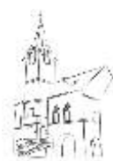
STARÁ RADNICE OSTROV

Společenský večer pro milovníky starších známých melodií. K tanci a poslechu hraje Taneční orchestr DK Ostrov.