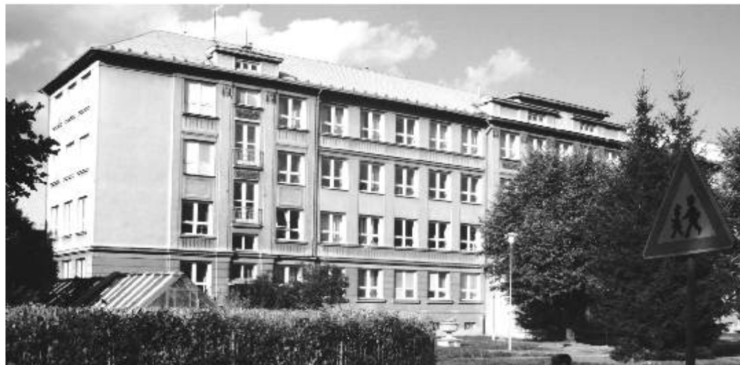
Současný pohled na školu

sem děti budou chodit rády proto, aby se něco nového a zajímavého naučily.