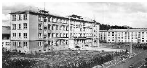
Škola po dostavbě

na strachu dětí ze své osoby. Pokud dítě svému učiteli věří, je pro něj snazší svěřit se mu se svými problémy a často se tak dá včas odhalit i šikana. Jako nový prostředek výuky u nás využíváme interaktivní tabule. Ty umožňují aktivní účast dětí při výuce a velké zpestření probírané látky. Děti se učí formou hry a to je baví mnohem více než tradiční výuka. Moderní učitelé se nesnaží do žáků vtouci co nejvíce letopočtů a vzorců, ale snaží se, aby měli o dané problematice nějaké povědomí a uměli si konkrétní informace najít, například na internetu. V naší základní i mateřské škole se mnohem více než jinde věnujeme žákům se speciálními potřebami. Učitelům pomáhají při práci asistenti pedagogů. Ve škole jsou