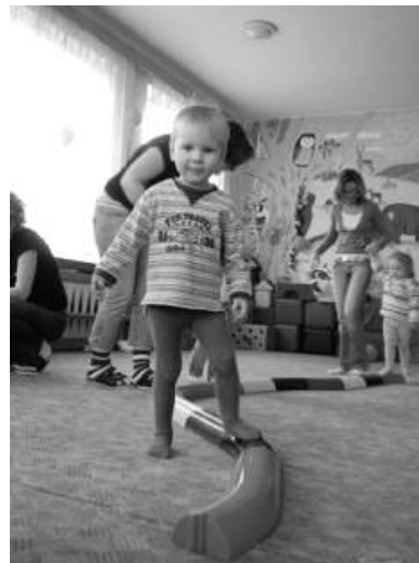
Miniškolička v MC Ostrůvek