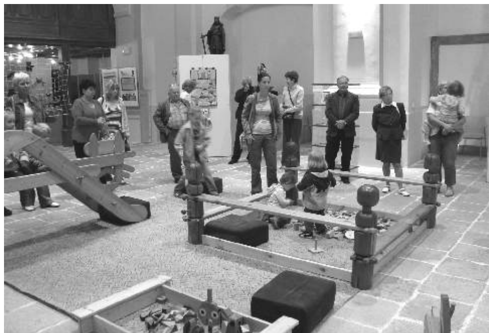
Spontánnost dětí dokreslila atmosféru vernisáže.