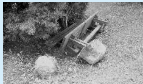
Řádění vandalů na dětském hřišti v Seifertově ulici