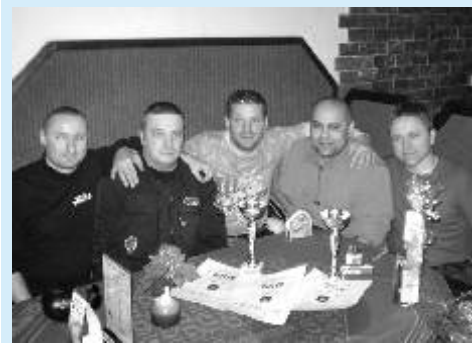
Ostrovští strážníci si odvezli zasloužené trofeje.

Oznámení, že neznámý pachatel načerpal na benzinové stanici pohonné hmoty a ujel bez zaplacení. Strážníkům se 42letého pachatele z Nového Sedla podařilo zadržet a předat k dalšímu šetření PČR.