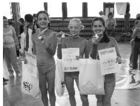
Gymnastky postupující do celorepublikové soutěže