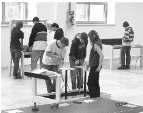
Žáci měli možnost exponáty vyzkoušet.

zúčastnili ukázky výcviku dravých ptáků v rámci oslav Dne Země. Ani výstavy v Ostrově neunikly naší pozornosti a šesťáci i osmáci oceňovali skryté krásy