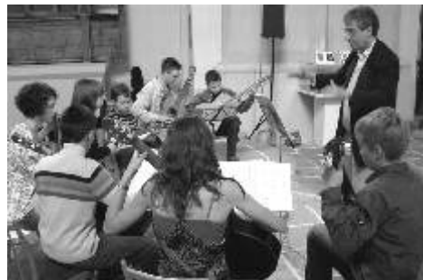
Kytarový soubor z Hofu