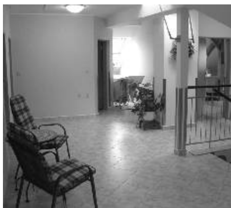
Domov pokojného stáří