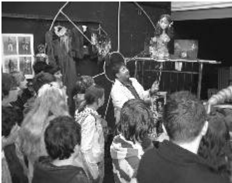
Prohlídka Divadla Alfa nadchla zúčastněné.

Malým předkrmem k nim byla určitě návštěva některých tříd I. stupně na výstavě IQ centra „Hry a klamy“ v Karlových Varech nebo exkurze devěťáků v Divadle Alfa v Plzni spojená s představením, prohlídkou Pivovarského muzea a Techmánie. Žáci se