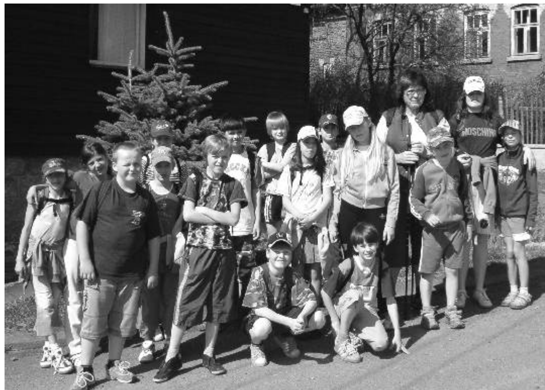
Škola v přírodě obohatila děti o zážitky.