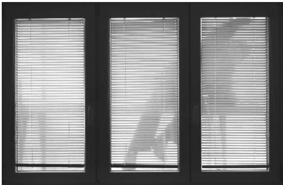
Ranní pohled z okna - fotografie měsíce Fotoklubu Ostrov.