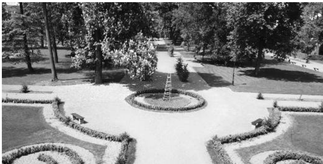
Zámecký park v Ostrově.