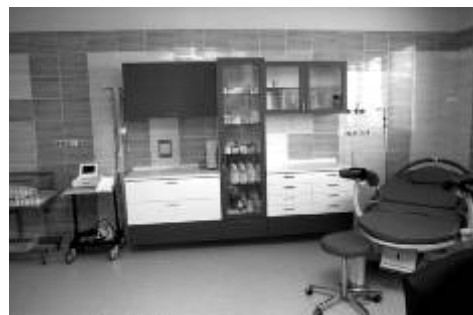
Nový porodní box v Nemocnici Ostrov

Součástí rekonstrukce sálů byla komplexní obměna přístrojového vybavení a příslušenství. Klientky jsou tak při příjmu k porodu i během přípravy na porod vyšetřovány na špičkovém moderním 3D sonografu. Monitorovací předporodní místnost je kromě individuálně nastavitelné klimatizace a polohovacího lůžka vybavena i plazmovou televizí s DVD, kde si klientka může zvolit program dle vlastního přání.