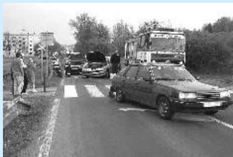
Dopravní nehoda na Jáchymovské ulici dne 22. dubna 2009

V dubnu si přítomnost naší jednotky vyžádalo celkem 13 událostí, z toho sedm požárů, jedna dopravní nehoda, tři technické pomoci, jeden únik látek a jeden planý poplach.