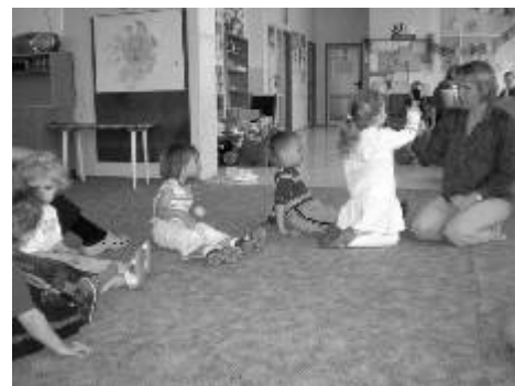
Miniškolička v MC Ostrůvek

Vítání miminek připravujeme na září, svá miminka můžete přihlásit již nyní na tel. 608 914 469. Bližší informace o všech akcích na letáčcích v IC v DK nebo na webových stránkách: www.mc-ostrovek.estranky.cz .