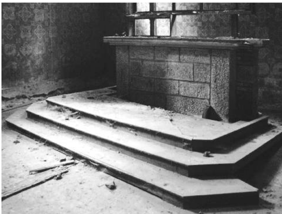
Torzo oltáře kostela Nanebevzetí Panny Marie ve Velichově