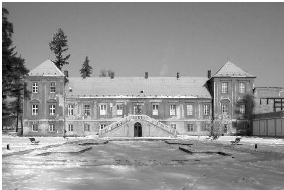
Palác princů s obnoveným schodištěm