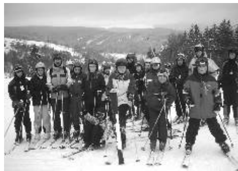
Účastníci lyžařského výcviku v Novém Městě Jáchymov