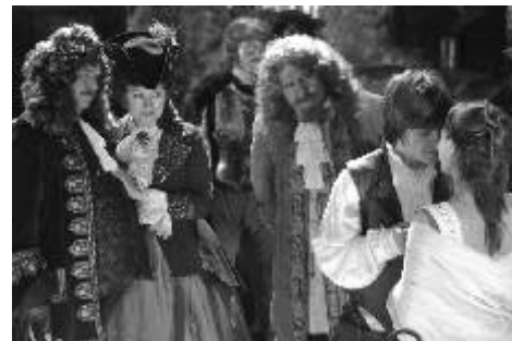
PEKLO S PRINCEZNOU

O ebenovém koni, Jo, ti kluci vzduchoplavci, Toulavé telátko, Míček flíček, Krtek a autíčko