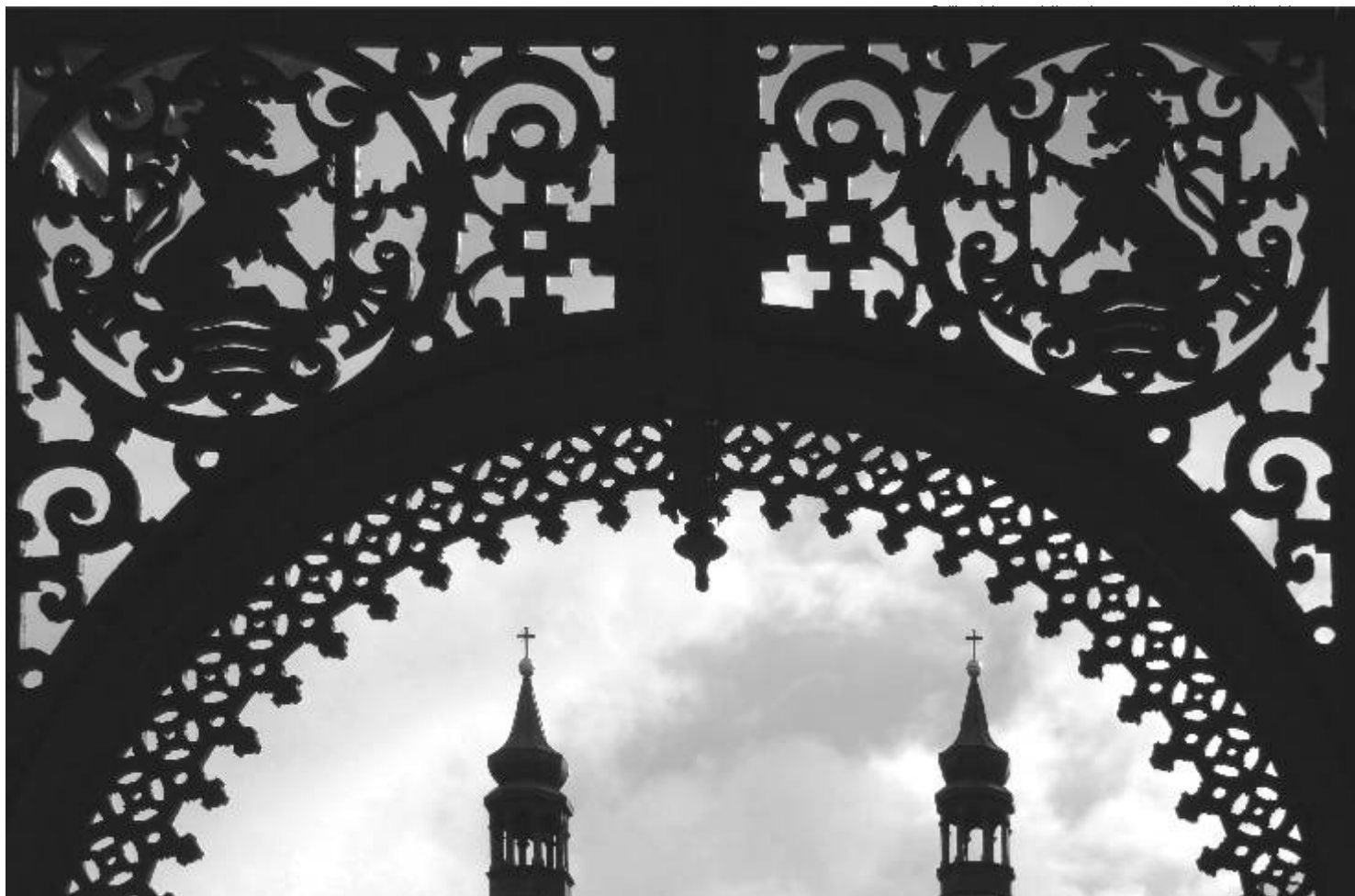
Kolonáda - fotografie měsíce Fotoklubu Ostrov.