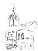
STARÁ RADNICE OSTROV

Společenský večer pro milovníky starších známých melodií. K tanci a poslechu hraje Taneční orchestr DK Ostrov.