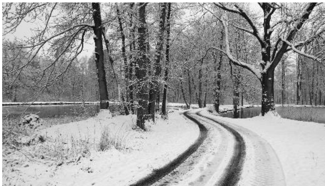
Borecké rybníky čekají na regeneraci (viz strana 3).

Redakční uzávěrka příspěvků do příštího čísla je 9. ledna!