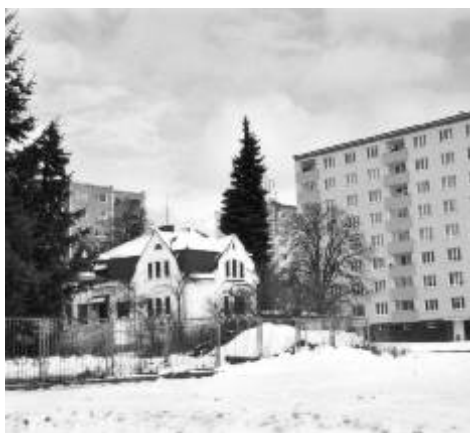
Hra času: Staré a nové