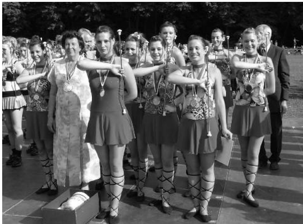
Z Mistrovství republiky mažoretek v Poděbradech v roce 2006, kde se ostrovská děvčata stala mistryněmi republiky.