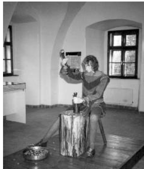
Ražba jáchymovského tolaru v expozici muzea Královská mincovna

Mincovna otevřena: st-ne 9.00-12.00 a 13.00-17.00 hodin 2.-11. ledna otevřeno, 12.-31. ledna zavřeno!