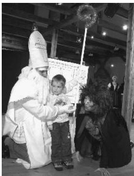
Statečný chlapec musel překonat strach z čerta, ale písničku nakonec zaspíval.

Příchod Mikuláše po skončení pohádky byl doprovázen nadšením a úsměvy. Typickou mikulášskou atmosféru umocňovaly jemné, nejisté hlásky v očekávání, co bude následovat. Nebylo ale nutné děti dlouho vybízet, aby se pochlubily písničkou či básničkou. Neváhaly si s Mikulášem a s čerty společně zaspívat i zatancovat. A protože byly všechny hodné, čekala na ně při odchodu domů štědrá nadílka. Aho