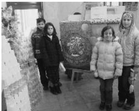
Vítězové výtvarné soutěže s tematikou třídění odpadu ze ZŠ praktické a ZŠ speciální Ostrov