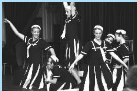
Mirákl zatančil hostům.