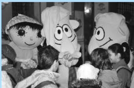
Děti baví pohádkové postavičky.