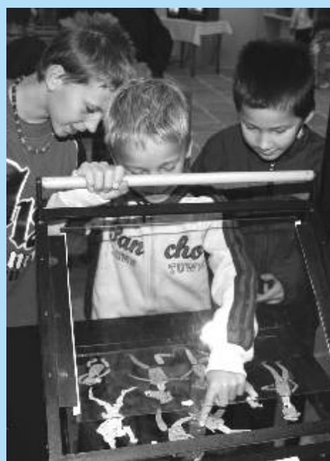
Na výstavě večerníčků