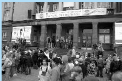
Hlavní dějiště festivalu