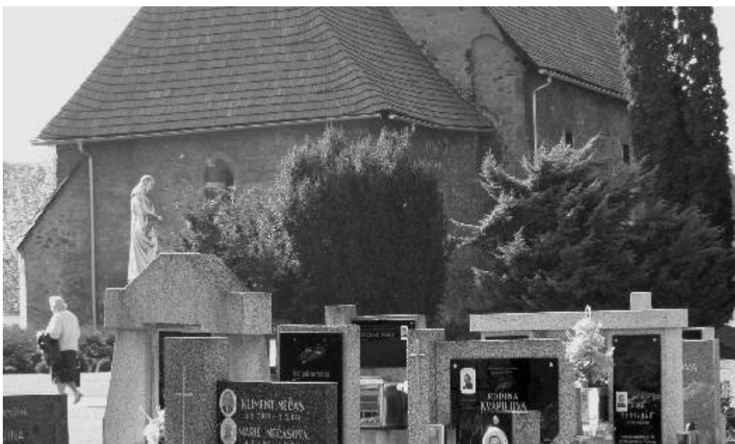
Hřbitovní kostel sv. Jakuba v Ostrově má po skončení rekonstrukce sloužit jako místo posledního rozloučení se zesnulými.

Redakční uzávěrka příspěvků do příštího čísla je 10. listopadu!