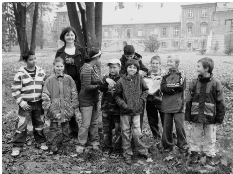
Žáci při plnění úkolu na školním projektu nazvaném Zámecká zahrada očima dětí

Víceúčelové hřiště, minihřiště, minigolf a stolní tenis jsou otevřeny denně do 17.00 hod., v sobotu a neděli 10.00-17.00 hod. Informace: po-pá 8.00-18.00 hod. v MDDM (tel. 533 613 248). Šárka Mářzová