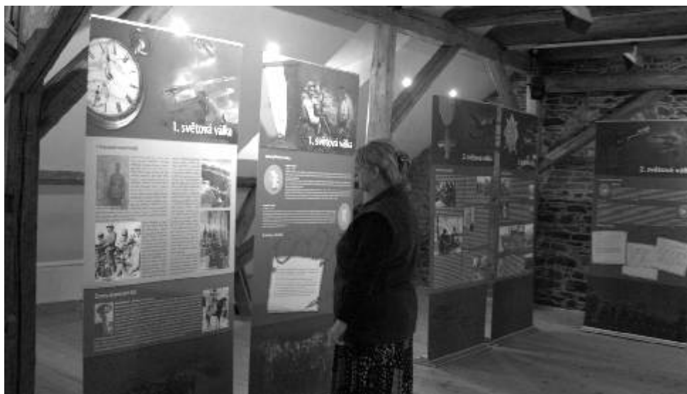
Výstava Bojovníci proti totalitě nabídla návštěvníkům dokumenty vytvořené samotnými dětmi.