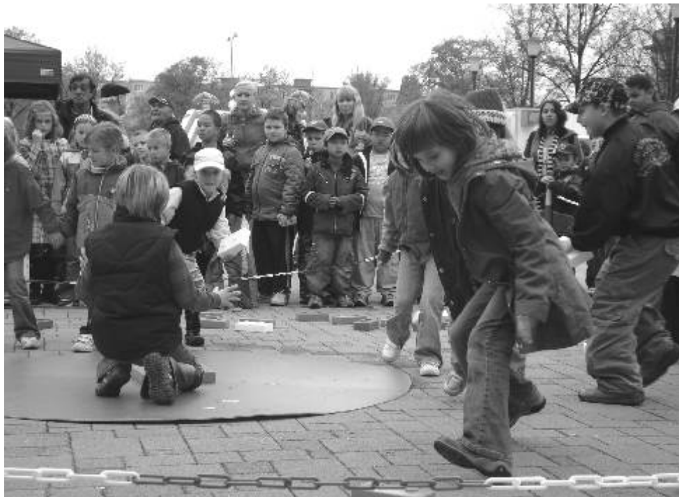
Odpoledne plné soutěží a zábavy uspořádal Městský dům dětí a mládeže ve spolupráci s DK Ostrov jako jednu z posledních akcí festivalu Oty Hofmana.