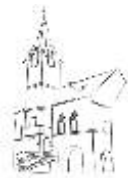
STARÁ RADNICE OSTROV

Závěrečný ples tanečních kurzů je určený všem absolventům, jejich rodičům i kamarádům.