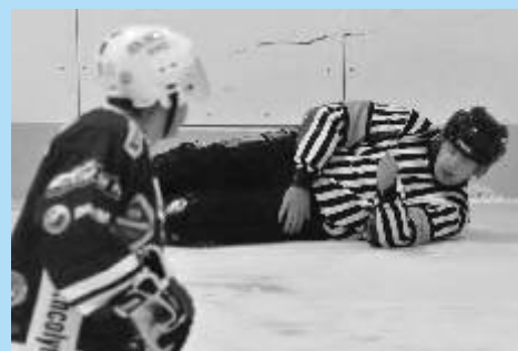
Hokejová show plná scének