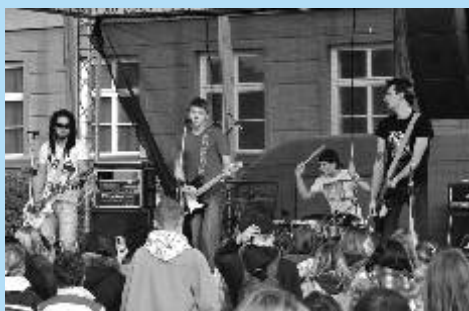
Kapela Mandrage z Plzně