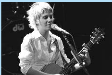
Galakonzert Anety Langerové