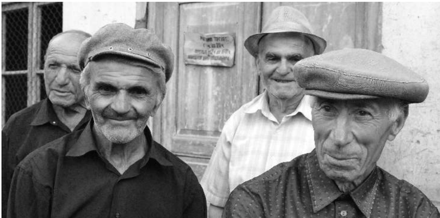
Fotografie měsíce: Gruzie 29.7.2008. Staříci z vesnice Tskaltbila, kde jsou velmi přátelští a pohostinní lidé. Zatím jim do smíchu. Ještě neví, co je čeká za necelý týden.

Fotoklub Ostrov vystavuje ještě po celý listopad fotografie svých členů v T-klubu v Domě kultury Ostrov. Návštěvníci kavárny tak mají příležitost seznámit se s činností Fotoklubu a zhodnotit práci jeho členů, případně se rozhodnout pro účast na jeho schůzkách na Staré radnici každý první čtvrtek v měsíci od 17 hodin.