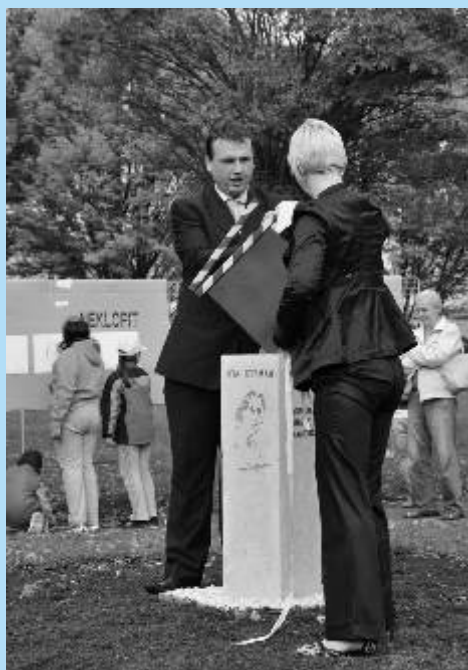
Odhalení filmové klapky