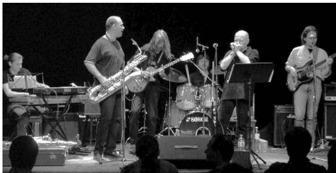
Křest CD v Husovce

Tento článek uzavřel seriál věnovaný ostrovským hudebním skupinám, z nichž některé působily na naší hudební scéně již od poloviny padesátých let. V budoucnu se chceme věnovat kapelám současným, které touto cestou vyzýváme a prosíme o spolupráci. Redakce