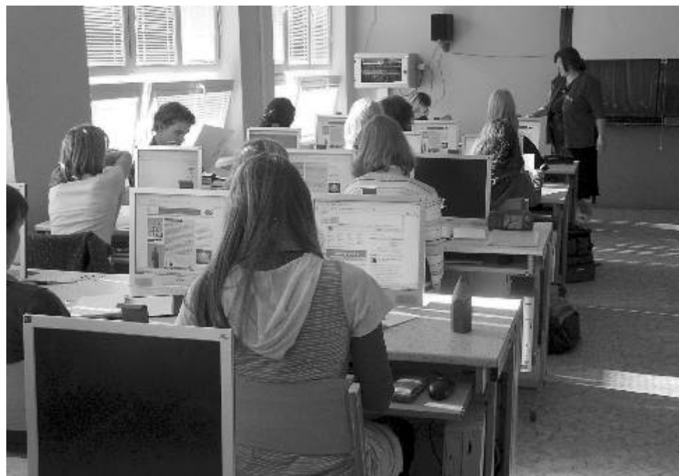
Počítače mohou nyní studenti Gymnázia využívat ve všech učebnách.