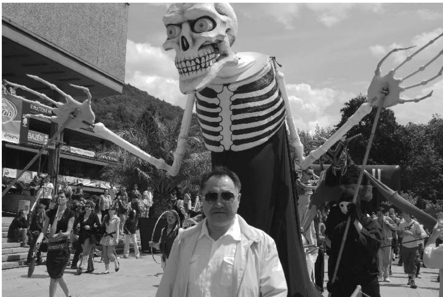
Fotoklub Ostrov. Fotografie měsíce: médium CCD, 1/1000 sec, f 6,3, ISO 200.

Četnická stanice Habersbirk srdečně zve všechny občany. Ing. Josef Macke, strážmistr četnictva