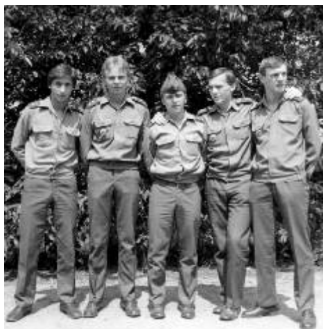
Spolubydliči z pokoje v Policejní škole 1980-1982 v Praze-Hrdlořežích

Každý má právo obracet se na strážníky s žádostí o pomoc; strážníci jsou povinni v rozsahu svých úkolů požadovanou pomoc poskytnout. Přál bych si, aby služba strážníka Městské policie byla především službou pro občany města. Městská policie při zabezpečování místních záležitostí veřejného pořádku například odhaluje přestupky a jiné správní delikty, dále přispívá v rozsahu stanoveném zákonem k bezpečnosti a plynulosti provozu na pozemních komunikacích, upozorňuje fyzické a právnické osoby na porušování obecně závazných právních předpisů a činí opatření k nápravě. To je jen krátký výčet úkolů