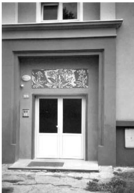
Na první pohled je patrný rozdíl mezi vchodem se sgrafitovou výzdobou a bez ní.