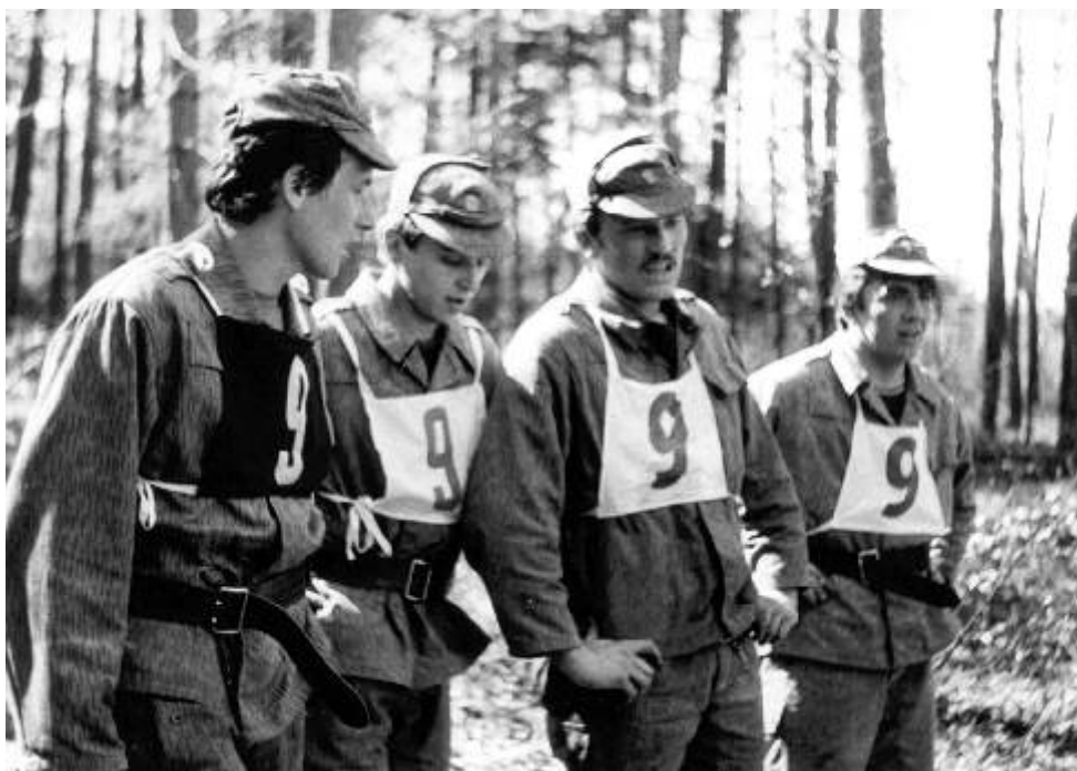
Branné bezpečnostní závod 1981