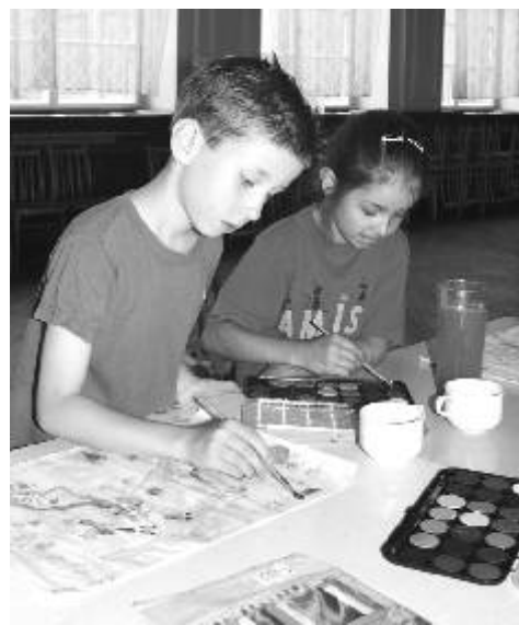
Hodina malování na Letní výtvarné dílně v DK Ostrov.