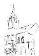
STARÁ RADNICE OSTROV

Začátek 22. září 20.00 hod. , dále každé pondělí až do 24. listopadu, 10 lekcí (20 vyučovací hodiny). Tanec jako součást moderního životního stylu pro každou věkovou kategorii!