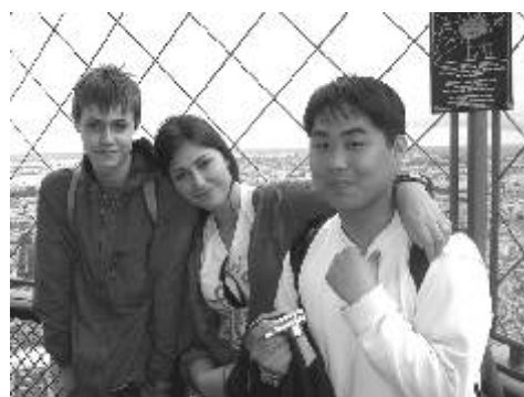
Studenti Gymnázia Ostrov na Eiffelově věži v Paříži