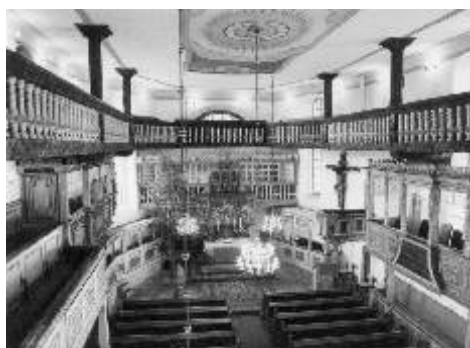
Scheibenbergský kostel sv. Jana se skví bohatou výzdobou. (Ilustrační foto)