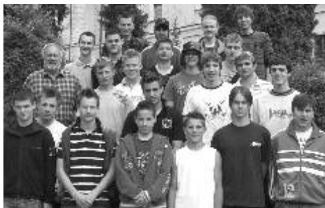
Úspěšní sportovci SPŠ Ostrov