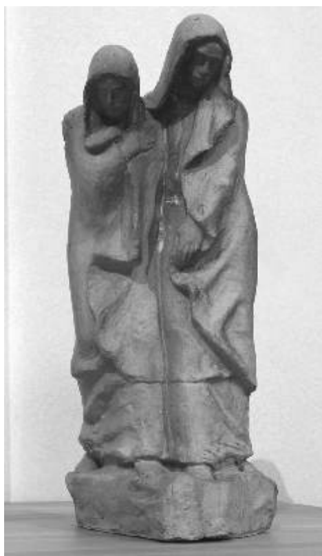
Zmenšená kopie plastiky Zaváté šlépěje od akademického sochaře Jaroslava Šlezinger.

Otevřeno: středa-neděle: 13.00-17.00 hod.