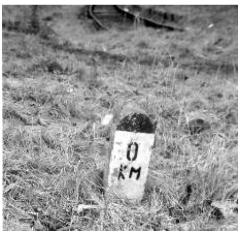
Historický nultý milník u dnes již neexistující vlakové trati do Jáchymova. Více o zaniklé trati čtete v příštím čísle OM.