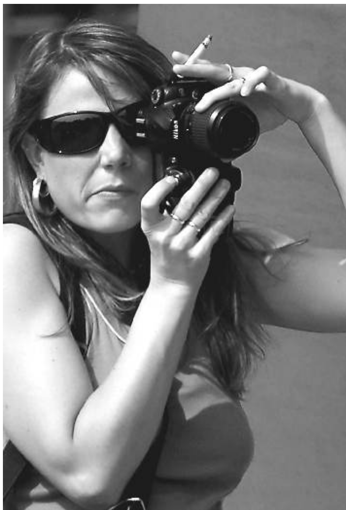
Fotoklub Ostrov. Fotografie měsíce: čas1/500, clona f/6,3 a ohnisko 200 mm. Autor: Miloslav Křížek