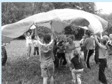
Hry a soutěže jsou na táboře běžnou náplní dne.

O příměstském táboře Ekocentra čtěte na str. 10.