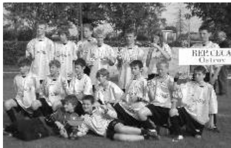
Úspěšní sportovci FK Ostrov.