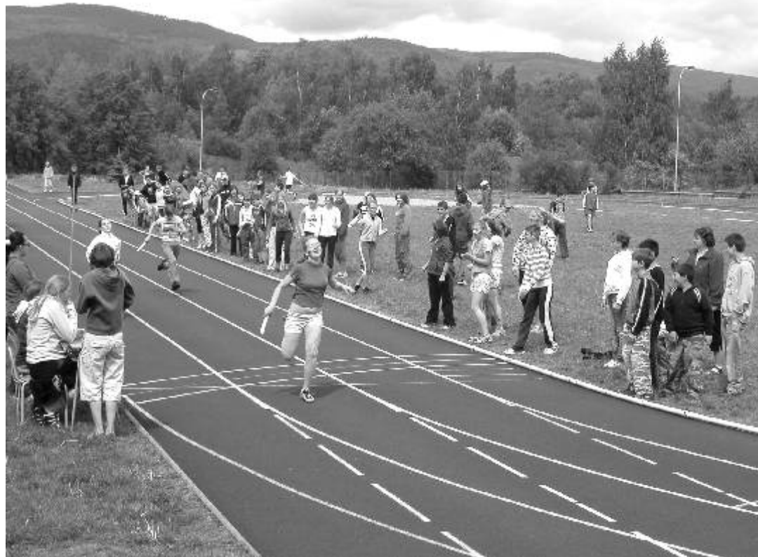
Ostrovská Minitretra mívá vždy dobrou účast.