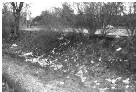
Jarní odpadky u OD Albert (snímek nahoře) a v Jáchymovské ulici poblíž sběrné (dole).