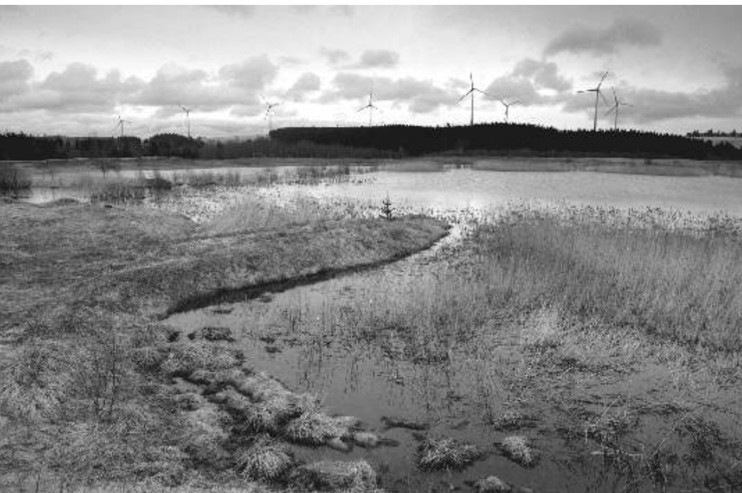
Fotoklub Ostrov představuje fotografii měsíce.