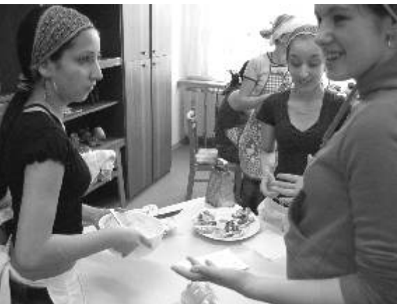
Na soutěži Praktická dívka žáčky pravidelně dokazují své dovednosti.

Další akcí, kterou mají děti velmi rády a kam pravidelně každým rokem jezdíme vystupovat, je Pohyb s hudbou. Přehlídku pohybu a tance doprovází hodnocená výstavka Kouzelný svět keramiky. Těšíme se také na pořádání okresního i krajského kola soutěže v lehké atletice, neboť očekáváme od našich žáků navázání na úspěchy z let minulých. Žáci školy praktické jsou šikovní ve sportu, pohybových disciplínách i zvládání počítače. Jistě si dobře povedou též na dopravním hřišti ve Staré Roli, kam vyjedou tento měsíc. Přejeme všem krásné a pohodové májové dny. Daniela Brodčová