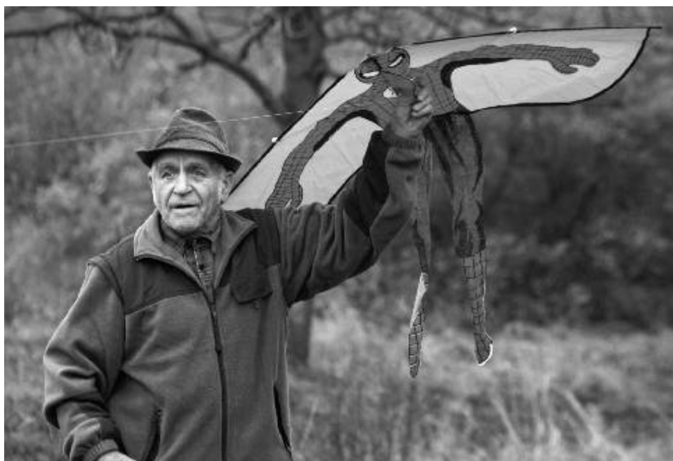
Podzim, 1/80 s, f 5,6, ISO 200, f=140 mm.