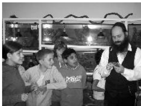
Žáci ZŠ praktické a ZŠ speciální na exkurzi v Ekocentru.