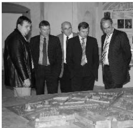
Zleva: starosta města Ostrova Jan Bureš, druhý zprava ministr pro místní rozvoj Jiří Čunek s doprovodem při prohlídce expozice v klášterním kostele.