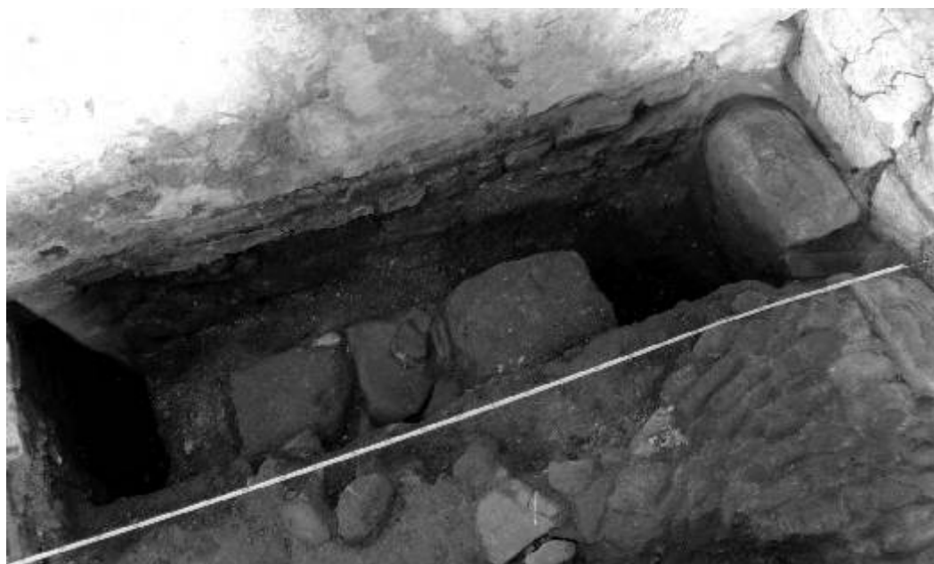
Archeologové objevili zbytky středověkého zdiva uvnitř kostela sv. Jakuba v Ostrově.

Redakční uzávěrka příspěvků do příštího čísla je 9. listopadu!