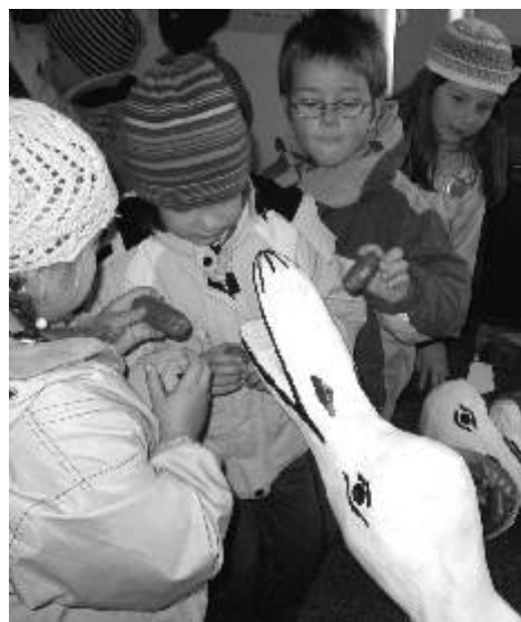
Na výstavě kuriozit ze života zvířat si děti vyzkoušely krmení osiřelého mláděte pelikána.