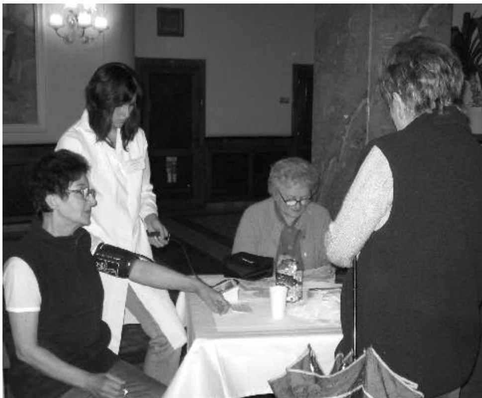
Územní organizace Svazu diabetiků Ostrov pořádá pravidelně v rámci prevence glykemické testy i pro širokou veřejnost. Na snímku je akce z 18. října v DK Ostrov.