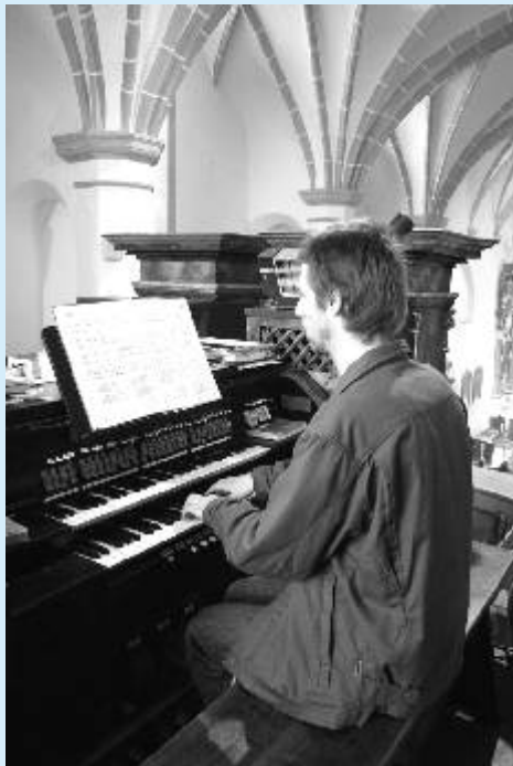
Vzácné barokní varhany v kostele sv. Michaela jsou díky opravám opět v provozu.

Bližší informace o programu Ostrovského varhanního jara přinášíme na straně 9.