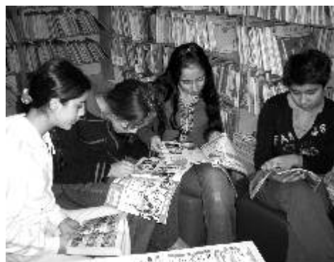
Den v Městské knihovně.