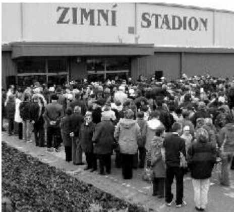
Slavnostní otevření Zimního stadionu v Ostrově