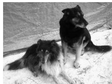
Opuštěná zvířata v lepším případě končí za plotem azylu Macík.