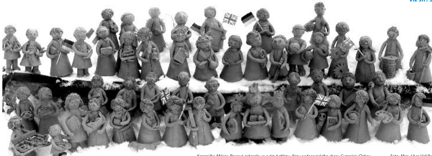
Keramička Milana Pincová zobrazila ve svém betlému členy pedagogického sboru Gymnázia Ostrov.

Příspěvky jsou redakčně kráceny. Umístění dětí v soutěži SuperČtenář viz str. 3