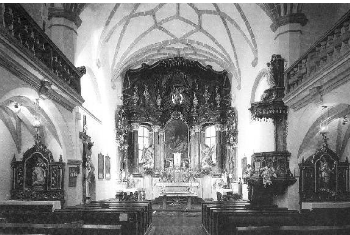
V ostrovském farním kostele sv. Michaela se v době Vánoc konají pravidelně bohoslužby.

Redakční uzávěrka příspěvků do příštího čísla je už 8. prosince