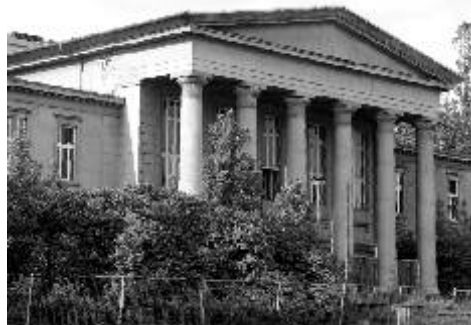
Jeden z městských domů ve stylu „Sorely“ v německém Chemnitz.

Evropské fondy a s nimi spojené projekty začínají být značně obehnanou písničkou. Pokud se však chceme zachovat odpovědně vůči sobě a naší budoucnosti, nezbyvá nám než hledat nejrůznější způsoby, jak se do této „hry“ úspěšně zapojit. V uplynulých letech se ostrovskému Domu kultury podařilo získat prostředky z EU již třikrát. Nejdříve to bylo ještě z projektu Phare na Českoněmecké setkání dětských médií v rámci festivalu Oty Hofmana a dvakrát, pokaždé z jiného fondu, na Česko-německé setkání výtvarníků. Trvalým plodem tohoto projektu, vedle úžasných lidských setkání, bylo zřízení profesionálního