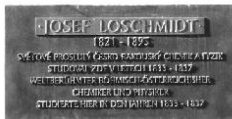
Pamětní deska Josefa Loschmidta je umístěna v klášterním areálu.