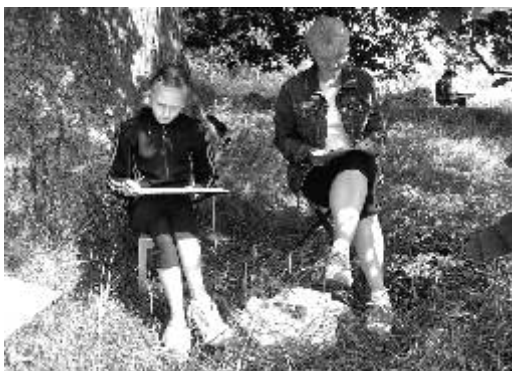
Malování v přírodě se nedá ničím nahradit.