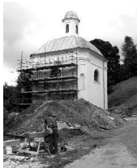
Práce na obnově klášterního areálu pokračují.

Dle kritéria nejnižší nabídková cena přidělila RM veřejnou zakázku „Obnova a podpora návštěvnosti regionálně významného rozsáhlého komplexu barokních památek“ (v areálu Zámeckého parku a bývalého kláštera) uchazeči Ing. Anton Jurica, stavební a projekční kancelář Boží Dar. Nabídková cena činí 26 635 944 Kč.