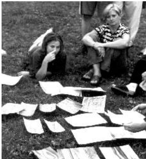
Chvilka zamyšlení nad hotovými pracemi.

V německé skupině byly výtvarnice, které se věnují malování už padesát let, a znovu a znovu vycházejí do krajiny a malují, míchají barvy, řeší kompozici... připadají mi v tomhle snažení velmi „uvěřitelné“