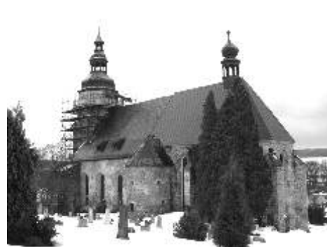
Kostel sv. Jiří v Horním Slavkově