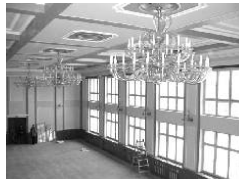
DK Horní Slavkov