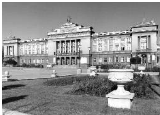
Dům kultury Ostrov (vlevo) a kulturní dům Horní Slavkov (vpravo)

Bohatá naleziště cínu, mědi a stříbra v okolí Horního Slavkova přilákala ve 14. století horníky z Míšně, kteří zde začali intenzivně těžit. Nastal rozkvět města. Také Ostrov prožíval v té době veliký rozmach. Význam města vzrostl i tím, že tudy procházela důležitá obchodní cesta z Chebu do Prahy, Ostrovu byly českými panovníky uděleny významné výsady a práva. Po husitských válkách a zvláště po třicetileté válce prosperita obou měst kolísala, ale v dalším období se situace změnila.