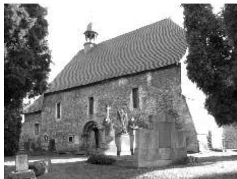
Kostel sv. Jakuba v Ostrově