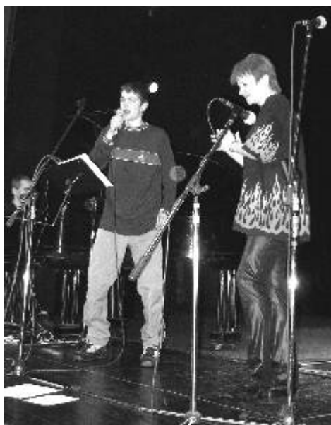
Jednoho z gymnazistů Jana Koubková přemluvila, aby na jevišti předvedl, jak umí rapovat.

Výchovný koncert se známou jazzovou umělkyní Janou Koubkovou uspořádalo ostrovské gymnázium začátkem února. V divadelním sále Domu kultury seznámila zpěvačka posluchače s jazzovými styly od prvotních spirituálů přes blues, rap a další žánry až po dnešek, přičemž se nejdéle zastavila u svého oblíbeného scatu, který sama nejčastěji ve svých vystoupeních používá. Za doprovodu saxofonu, klavíru, baskytary a bicích předvedla z každého žánru ukázkou a vyzvala studenty, aby spolupracovali, takže se chvílemi v sále ozýval zpěv i rytmické tleskání diváků. (jan)