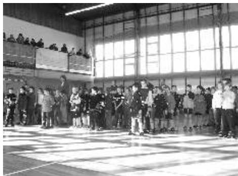
Žáci čekají na předání cen.