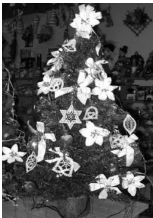
Zájemci o tradiční vánoční zdobení svých domovů se mohli přijít inspirovat i poučit také do Domu kultury na předváděcí akci dne 27. listopadu. Na snímku je stromek ozdobený paličkovanou krajkou.

Vánoce jsou pro každého z nás především starost, čím obdarovat nejbližší, jak stihnout vánoční úklid a vyhnout se přetížení. Největší radost z nich mají zřejmě děti, kterých se ještě starosti tolik nedotýkají. V některých domácnostech se z Vánoc stal jakýsi strašák, takže se rodina spíše těší, až „bude po všem“. Přitom by Vánoce měly být především svátky klidu a pohody.