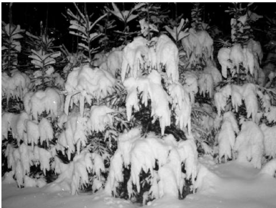
V předvánočním období je ochrana lesů před zloději a vandaly posílána mimořádnými hlídkami

Živé vánoční stromky se v minulých letech jednoznačně prodávaly častěji než stromky umělé. Letos se situace nápadně změnila, v obchodech jdou oproti jiným rokům umělé stromky více na odbyť.