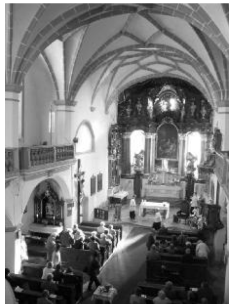
Vánoční mše v Ostrově se budou konat jako obvykle ve farním kostele sv. Michaela

Knihovna sv. Anny v přízemí fary (Malé náměstí 25) je otevřena ve čtvrtek od 15.00 do 18.00 a v neděli od 10.00 do 11.00 . V prosinci se v ní koná prodejná výstavka knih z produkce křesťanských nakladatelství .