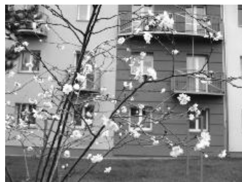
Téměř současně s příchodem prvního sněhu v Ostrově rozkvetly japonské třešně. Kolemjdoucí je mohli spatřit poblíž městské ubytovny nad ulicí Odborů.