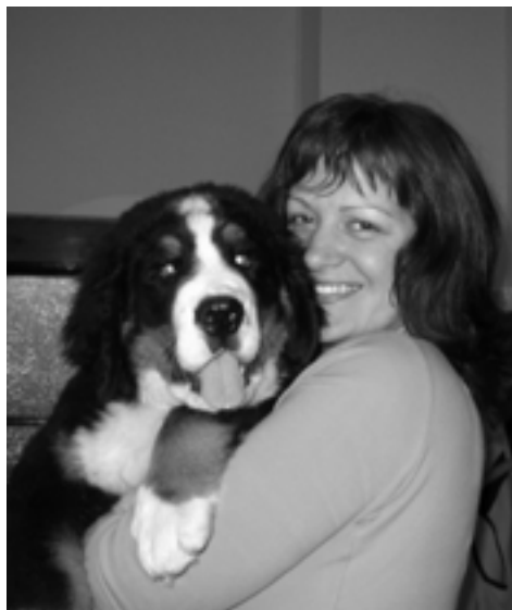
Zvířecí miláčci nejsou jen pro potěšení, je také třeba se o ně zodpovědně starat