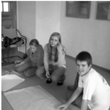
Studenti si vyzkoušeli různé techniky