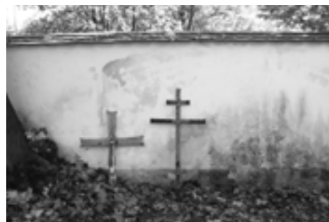
Součástí sanktusníku jsou kříže, na snímku krátce po snesení ze stěhy na zem