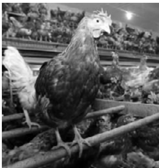
Obávanou ptačí chřipku prý nejčastěji roznáší slepice. Ve vzácných případech se přenesou ptačí virus z ptáka na člověka, mezi lidmi se zatím nešíří

Na podzim klesá odolnost a zvyšuje se počet infekčních onemocnění, takzvaných nemocí z nachlazení. Stále ještě je aktuálním tématem chřipka. Jako nejspolehlivější ochranu před ní doporučují lékaři očkování. Přesto tuto možnost až donedávna nevyužíval příliš velký počet obyvatel. „Já se nechávám očkovat každý rok, protože jsem náchylný na infekce, kamarádi se mi ale kvůli tomu posmívají, oni prý budou rádi, když nebudou muset do školy,“ říká sedmnáctiletý ostrovský středoškolák Jan. Očkovat se proti chřipce pravidelně nechávají lidé od 65 let, kteří je mají zdarma, a pak ti, kteří jsou více ohroženi nákazou kvůli svému povolání. „Dávám se očkovat každoročně, a musím říct, že to je znát, už pár let jsem nebyla nemocná,“ potvrzuje osmdesátiletá Marie z Ostrova.