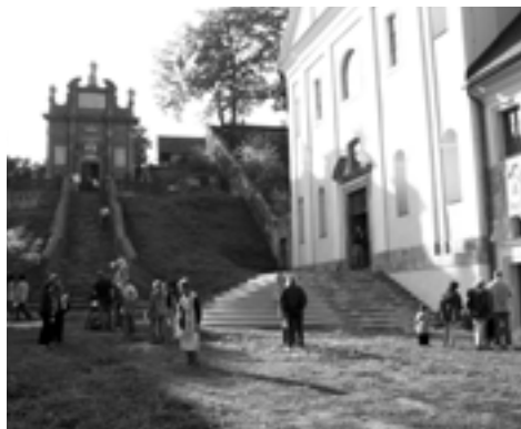
Naučná stezka zavedla tentokrát účastníky k ostrovským památkám