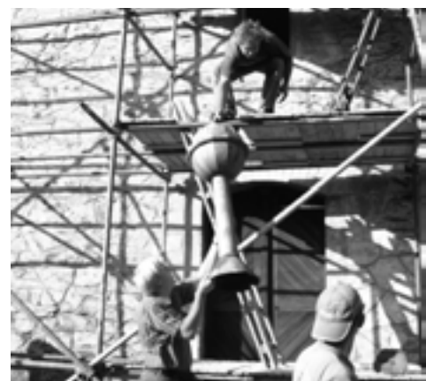
Snést zinkovou makovici ze střechy kostela vyžadovalo sílu a dobrou kondici

Další informace k tématu přinášíme na straně 11