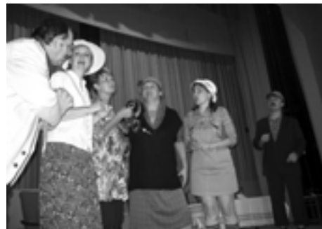
Z premiérového představení hry Rajčatům se letos nedaří