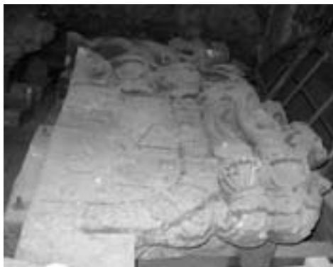
Části původního kamenného erbů Bílé brány

„Klimatické vlivy bohužel nebyly jediným důvodem zničení těchto kamenných částí. Také na nich zapracovali zloději, rozebírali například uvolněné kameny ze schodiště Paláce princů, aby je použili při stavbě základů rodinných domů. Schodiště bylo dlouhá léta vydáno napospas i vandalům, kteří chátřející kameny