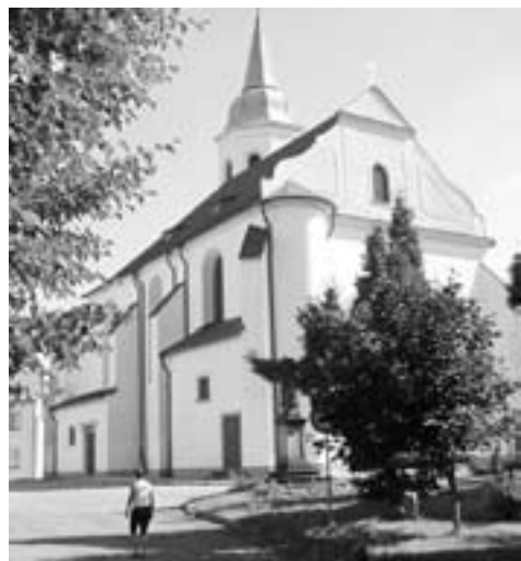
Kostel sv. Michaela v Ostrově byl kdysi vyhledávaným poutním místem