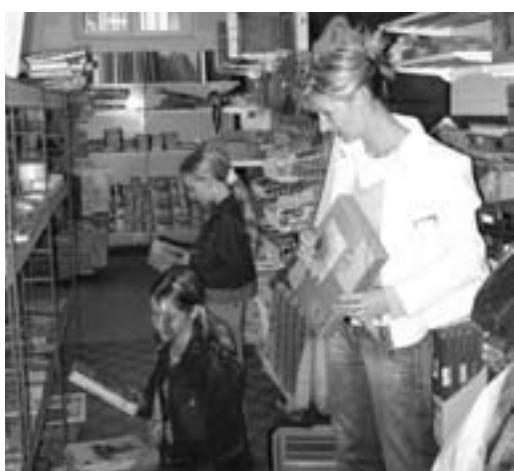
Kdo si nakoupil v klidu o prázdninách, vyhne se v září frontám

Začátek září je vždy ve znamení nástupu do školy. Nákup školních pomůcek je pro většinu rodičů i žáků spíš nepříjemnou povinností, ale pro ty, kteří se do školy chystají poprvé, může být zdrojem velké radosti. Rodiče prvňáčků pravděpodobně nakupují s předstihem, protože vstup do první třídy bývá významnou událostí pro celou rodinu. Opozdilci si budou muset v září již vystát frontu.