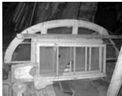
Součástí klášterní sbírky budou i fragmenty barokních oken