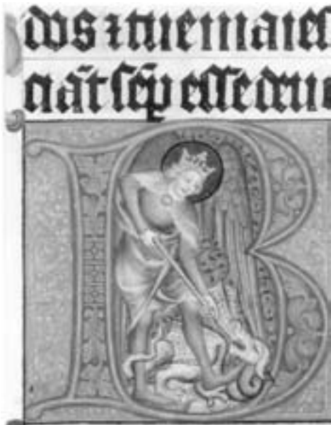
Archanděl Michael v tradičním vyobrazení s drakem

Na konci září slavíme každoročně svátek tří svatých archandělů - Michaela, Gabriela a Rafaela. V Ostrově byl farní kostel zasvěcen prvnímu z nich. Mnozí z nás viděli barokní zpodobení archanděla Michaela