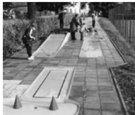
Víceúčelové hřiště Domu dětí nabízí kromě jiných her také populární minigolf

Občanské sdružení Korona vás zve na přehlídku japonského animovaného filmu