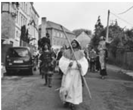
Členové divadla v jarmarečním průvodu

Velkou dávkou fantazie prokazují herci nejen při originálním ztvárnění námětů, ale i při výběru a tvorbě kostýmů, z nichž si převážnou většinu vyrábějí sami. Příkladem je režná halena, sloužící jednou jako oblečení chůdaře, jindy jako róba vypravěče v Arše