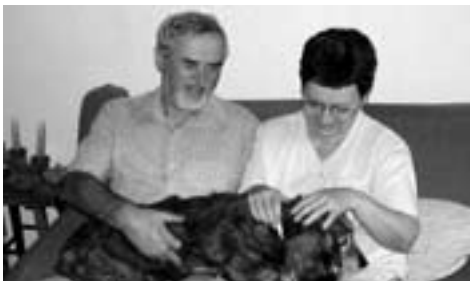
Odpočinek v důchodu umožňuje mimo jiné vychutnat si chvíle rodinné pohody

Neprosazovala jsem je sama, pomáhali mi všichni ostatní. Zavedli jsme rozšířenou hudební a výtvarnou výchovu, přípravné třídy, jako jedni z prvních jsme vypracovali speciální program pro děti s vývojovými poruchami. Nová koncepcí brzy přinesla výsledky. Škola se každoročně účastní dětského humanitárního hnutí Stonožka, ve kterém děti dosahují významných úspěchů. Školní pěvecké sbory vyhrávají soutěže, řada žáků se dostala na odborné hudební školy. Dvakrát ročně děti představují své umění na školních Akademiích. Naplnila se i má vize vyzdobit školu pouze dětskými pracemi. Snad