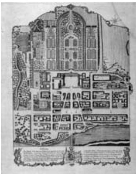
Plán barokního centra města Rastattu z doby kolem roku 1780

Pak přišlo pár pozvání od přátel na místa, kde se něco zajímavého odehrává. Obrázky postupně přibývaly, a s nimi i chuť vytvořit film, ve kterém bych pro ně našel využití. S tím, jak jsem natáčení přesouval do více obydlených částí Karlovarska, začali za mnou přicházet místní lidé. Ptali se, co že to tam provádím, chtěli se podívat do hledáčku. Pak mi většinou vyprávěli příběhy, které se vázaly k místu kde žijí, a o kterých se třeba dnes už neví. A ty krásné příběhy najednou začaly do toho prostředí zapadat a podkreslovat obrázky, které se mi odvíjely před kamerou.